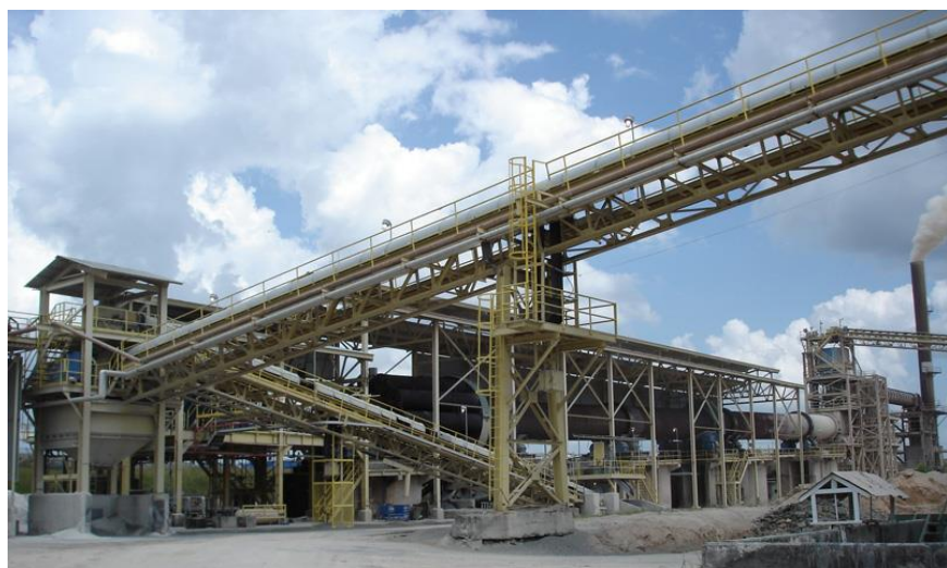
博赛矿业铝矾土厂——当地最大中资企业

截至2016年底，圭亚那中资企业协会有19家会员单位，其中工程承包企业6家。在圭中资企业主要涉及工程承包、农林业、矿业和商贸等领域。