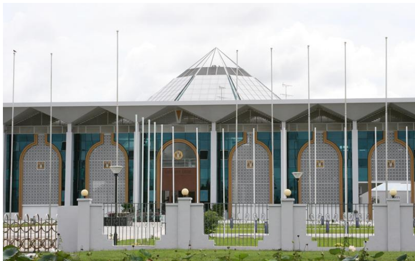
中国援建的钟亚瑟会议中心（原国际会议中心）

第11期欧洲发展基金将在到2020年期间向圭亚那提供3400万欧元援助，主要用于应对气候变化、减灾、可持续的基础设施建设（包括海防）等方面。2016年3月28日，印度进出口银行与圭亚那财政部签署“东海岸/东岸道路链接项目（East Coast/East Bank Road Linkage Project）”协议，印度进出口银行将出资5000万美元用于该项目。2016年6月，圭亚那已从“英国-加勒比基础设施基金”中获得5320万英镑的资金支持，用于完善供水系统和建设内陆机场等项目。