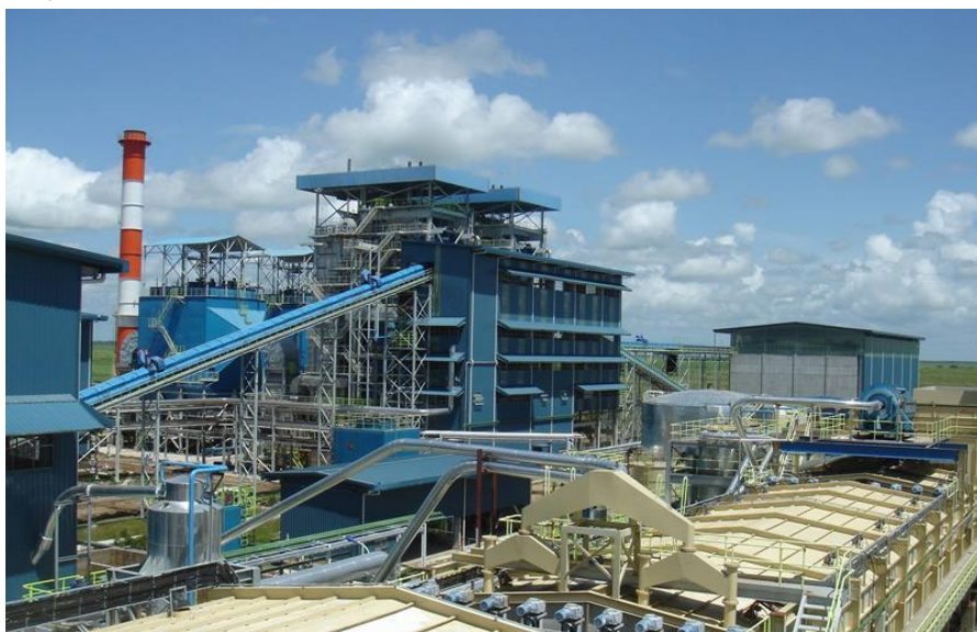
斯凯尔顿糖厂——中国在圭亚那最大承包工程项目

【在建项目】截至2019年5月，中资企业在建和即将开工的工程承包项目包括：中国港湾工程有限责任公司承建的切迪·贾根国际机场改扩建飞马酒店企业中心和公寓酒店项目，中铁一局集团公司承建的德莫拉拉东海岸公路改造项目。新签大型工程承包项目包括中国港湾工程有限责任公司承建圭亚那套房酒店和办公中心项目；中国水电建设集团国际工程有限公司承建埃特夫拉格特戴蒙德和希特安佳水处理设施和管网升级工程项目等。