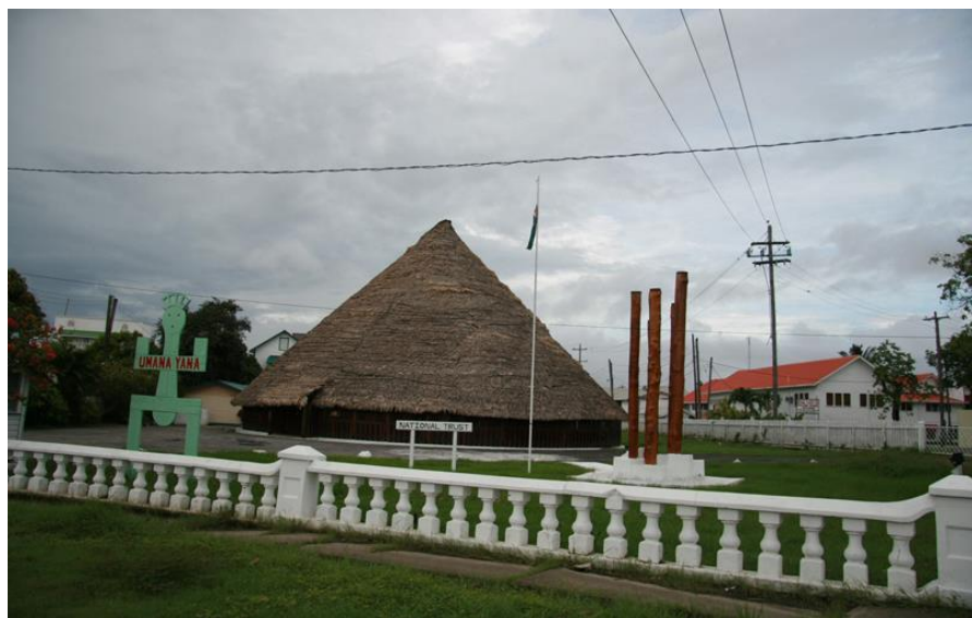
大草棚——圭亚那著名景点

《圭亚那评论》(Guyana Review)为唯一新闻性杂志,1993年创刊,发行量约2000份。