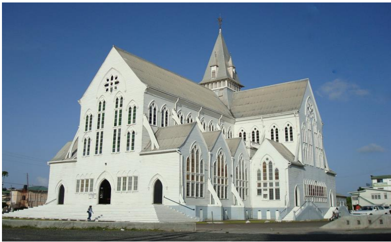
圣乔治大教堂——世界上最高的木质教堂

圭亚那官方语言和通用语是英语。广泛使用克里奥尔语（以英语为基础，借用荷兰语、印地语、非洲和印第安语）。印度教和穆斯林信徒在宗教仪式中则分别使用印地语、乌尔都语和阿拉伯语。大多数印第安人会讲9种部落语言中的一种或数种，华人圈内则多讲普通话。