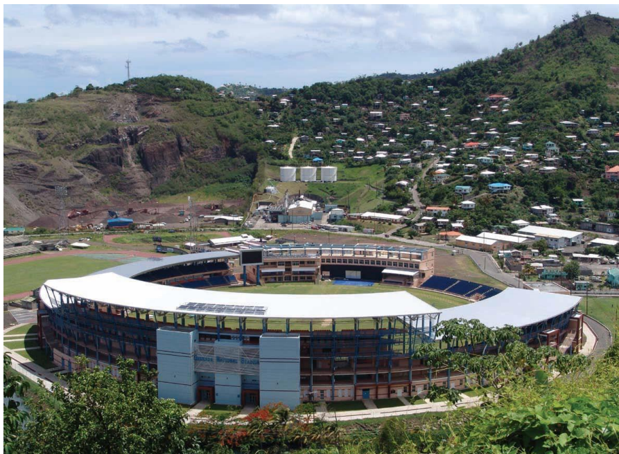
中国援建的格林纳达国家板球场

【 双边贸易 】中格双边贸易起点低，贸易额较小。据中国海关最新统计数据，2018年对格林纳达贸易总额达1314.9万美元，同比增长22.7%。其中中国对格林纳达出口1314.6亿美元，冗笔增长22.9%；中国从格林纳达进口为0.3万美元，同比下降77.8%。据中国海关统计，近年来，中国对格林纳达出口商品主要为电子零部件和办公配件、广播设备、橡胶轮胎、电话、铝条、服装、金属模具、石材、家具、汽车等。