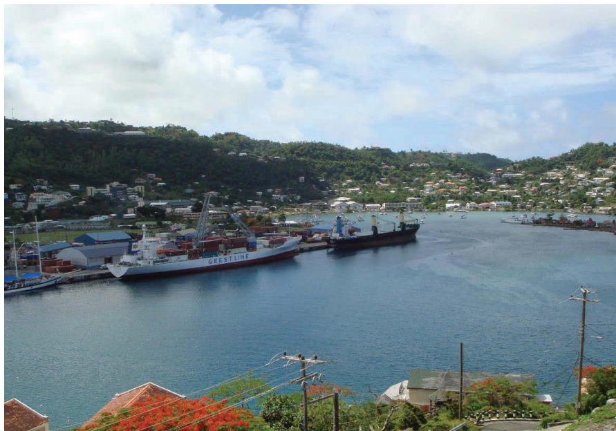
圣乔治港货运码头

格林纳达全岛有近40个大小不等的码头，首都圣乔治为主要港口城市，圣乔治港游轮码头可提供375米长泊位两个，水深10.6-19米。内港码头提供335米长的泊位一个，水深9米，客货轮两用。岛北部港码头可停泊一艘万吨级客轮。格林纳达有便利的水上交通，有快艇、游船和渡船服务。平均每年约有150-160艘游轮停靠格林纳达港口。格林纳达虽然没有自己的船运公司，但运输代理可提供全程服务。2015年格林纳达港口具备3.6万平方英尺泊位和5英亩集装箱堆放区。