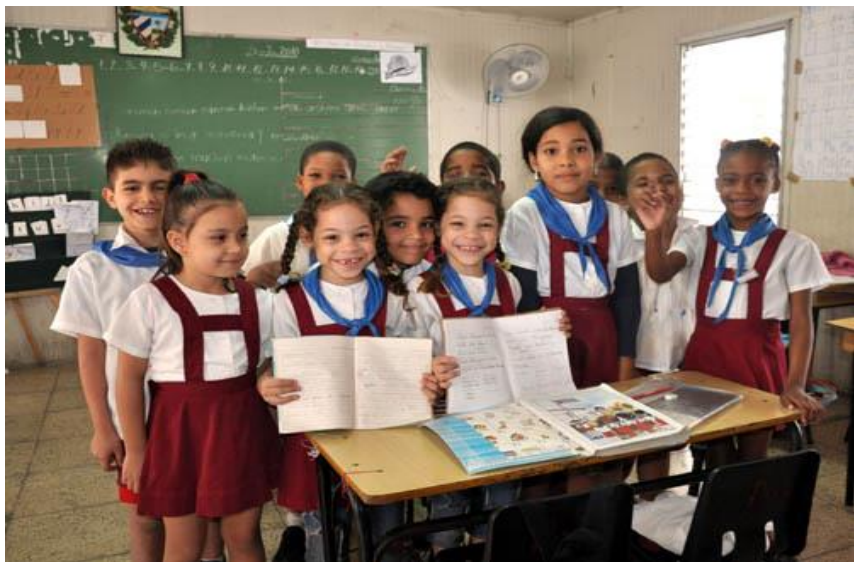
身着校服的古巴小学生

【教育】古巴政府历来重视发展教育。目前，古巴是拉美地区识字率和平均受教育水平最高的国家，教育水平居世界前列。根据联合国教科文组织《2015全民教育发展指数》，古巴在117个国家（地区）中排第28位，在拉丁美洲国家中排名第一。