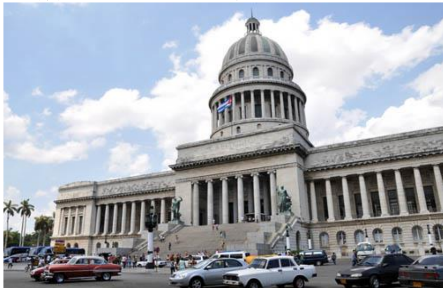
哈瓦那旧国会大厦

圣地亚哥市位于古巴东部，是古巴第二大城市和第二大港口，人口43.35万（2017年）。卡马圭市是古巴面积最大的省—卡马圭省（位于古巴中部，占全国总面积的14%）的省会，是重要的工业、贸易和交通中心。