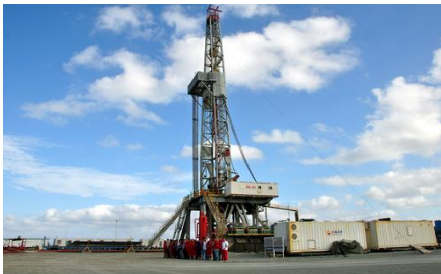
位于古巴哈瓦那近郊的石油钻探基地

【案例】古巴圣地亚哥海运港口项目已于2019年初完工。古巴圣地亚哥海运港口项目由中国提供信贷和技术支持，目前项目工程进度已过四分之三。此外，巴拉科阿港口疏浚和护岸工程正在开展中，未来该港口可供更大型船只停靠。该工会组织代表还指出，在利用外资促进港口作业能效提升的同时，古巴境内港口海运行业从业人员的工作条件获得改善，其收入亦实现了增长。