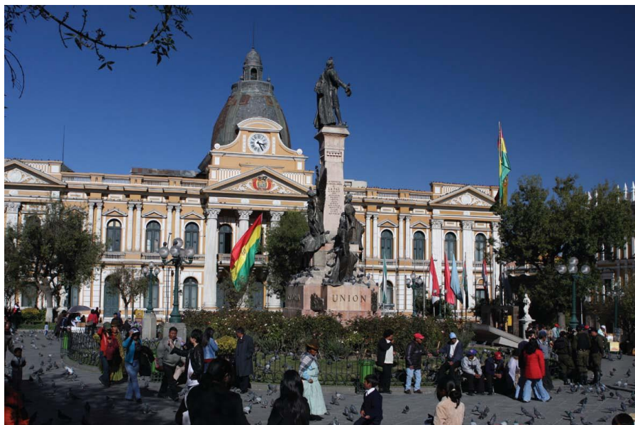
穆里略广场—总统府和议会所在地

全国人口1144万（2019年5月），其中，圣克鲁斯省人口最多，为322万人；其次是拉巴斯省，288万人；科恰班巴省人口为197万人，排在第三位。在玻利维亚华人数量约为9000人左右，主要集中在圣克鲁斯省。