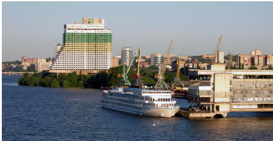
乌克兰河港城市第聂伯

2018年，乌克兰水运客运量70万人次，同比增长13%，客运周转量2760万人公里，同比减少9.1%。货运量560万吨，同比减少5.1%，货运周转量33.63亿吨公里，同比减少21.3%。乌克兰主要海港有：南方港、敖德萨港、尼古拉耶夫港、黑海港（伊利乔夫斯克港）、赫尔松港、马里乌波尔港等。乌克兰是重要的黑海海运交通枢纽。