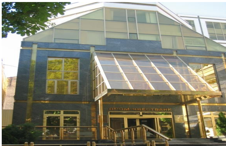
由中资公司承建的乌克兰工业投资银行大楼

【货币互换协议】中乌两国2012年6月签订总额合24亿美元的3年期货币互换协议。2015年4月底，乌克兰国家银行与中国人民银行达成共识，将两国货币互换协议延长3年。互换规模为540亿格里夫纳和150亿人民币（约为24亿美元），协议有效期3年，2015年6月23日生效。2018年12月，中国人民银行与乌克兰国家银行续签了中乌（克兰）双边本币互换协议。协议规模为150亿元人民币/620亿格里夫纳（约24亿美元），协议有效期3年，经双方同意可以展期。