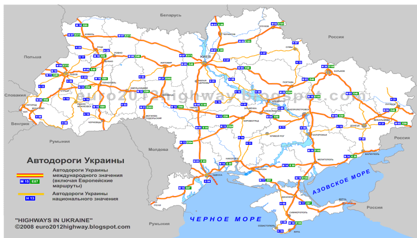
乌克兰国际公路图

乌克兰政府加大了对公路建设的投入力度，设立了2018-2022年公路发展目标，计划拨款3000亿格里夫纳修建公路。2018年乌克兰公路实现货运量1.87亿吨，同比增加6.1%，货运周转量425.7亿吨公里，同比增加2.7%。客运量19.07亿人次，同比下降5.6%，客运周转量345.6亿人公里，同比减少2.7%。