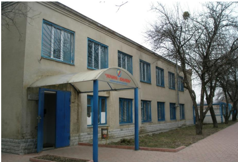
乌克兰运城彩印公司外景

计部合作协议》《中华人民共和国和乌克兰进出口商品合作评定合作协议》《中华人民共和国政府与乌克兰政府关于标准计量合格评定合作协定》和《中华人民共和国和乌克兰知识产权保护协定》等，上述协定为中乌双方企业开展经济贸易合作奠定了牢固的法律基础。