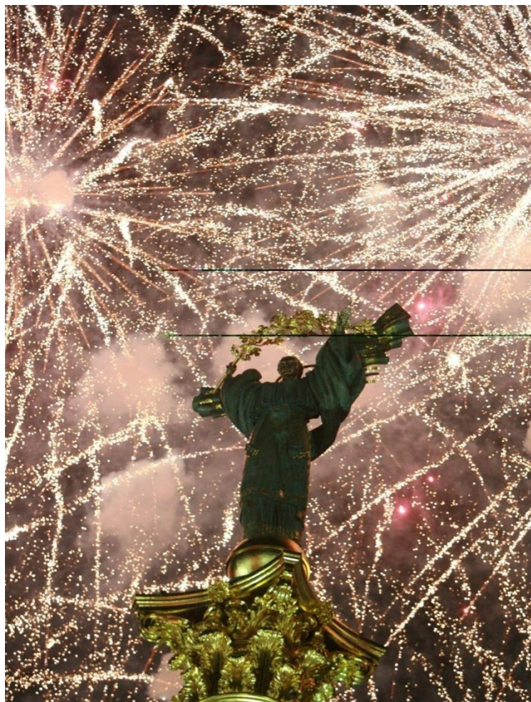
乌克兰基辅独立纪念碑

1990年7月16日，乌克兰议会通过《乌克兰国家主权宣言》。1991年8月24日，乌克兰宣布独立。1991年12月25日，苏联解体，乌克兰成为独立国家。1996年，乌克兰通过新宪法，确定乌为主权、独立、民主的法制国家，实行共和制。