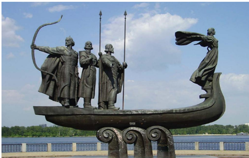
基辅创始人四兄妹雕像

乌克兰全国大部地区为温带大陆性气候。1月平均气温-7.4℃，7月平均气温19.6℃。克里米亚为地中海型亚热带气候。