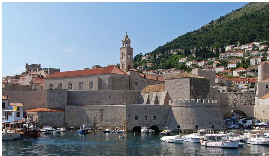
杜布罗夫尼克古城堡

其他主要的经济中心城市有斯普利特、里耶卡、奥西耶克等。其中,斯普利特是克罗地亚第二大城市,达尔马提亚地区第一大海港、造船和航运中心,也是东南欧最著名的旅游胜地之一。