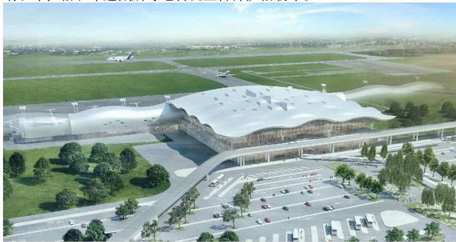
萨格勒布机场新航站楼

目前，中国至克罗地亚无直达航班，但可经莫斯科、法兰克福、维也纳、布拉格、布达佩斯等地转机至首都萨格勒布。