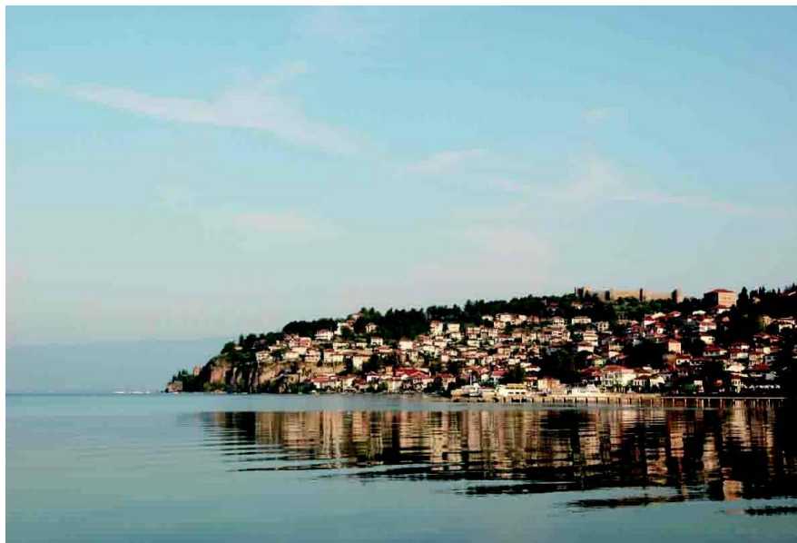
奥赫里德市老城，山顶为塞缪尔城堡遗址

自1993年以来，北马其顿陆续成为世界银行和国际发展协会的成员国，并于2003年加入世界贸易组织。