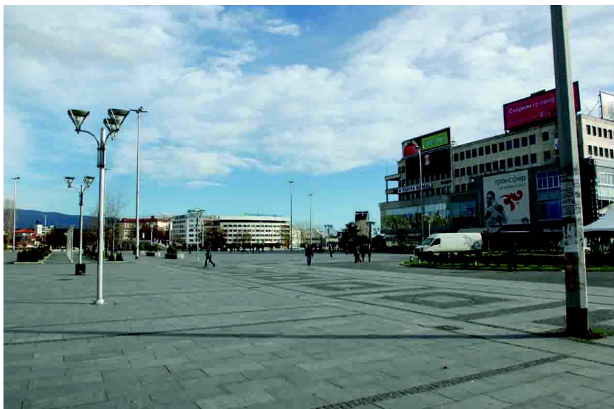
斯科普里市中心“喷泉广场”

首都斯科普里是北马其顿政治、经济、文化和交通中心，位于北马其顿西北部，海拔240米。斯科普里四周高山环绕，瓦尔达尔河贯穿整个城市，夏季炎热，冬季寒冷，全年降水均匀，年均降雨量483mm，平均温度12.4℃。斯科普里现有人口约61万。该市是巴尔干半岛通往爱琴海和亚得里亚海的重要交通枢纽，是全国最大烟草加工中心，还有冶金、机械制造（汽车、农业机械等）、化学、电气器材、水泥、玻璃等工业。这里还以金银饰品等手工艺品闻名。斯科普里大学是北马其顿最大的综合性大学，为北马其顿培养了大批专业技术人才。