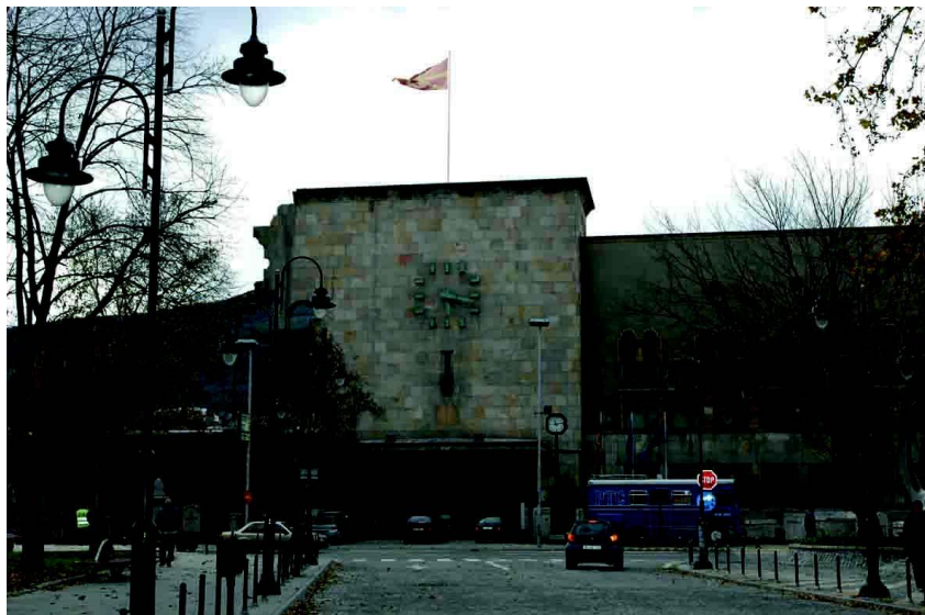
斯科普里市地震博物馆，1963年大地震后遗留的残垣断壁仍清晰可见