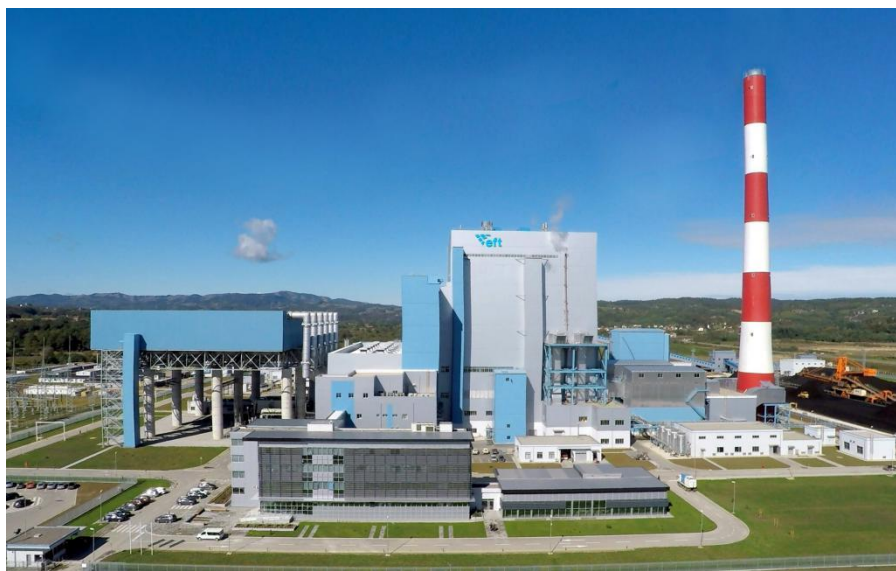
斯塔纳里火电站外观

【主要合作项目】2007年，华为公司以香港华为有限公司的名义在萨拉热窝注册办事处，在波黑提供通信设备、安装和调试业务。2009年4月，正式注册为华为波黑技术有限公司。