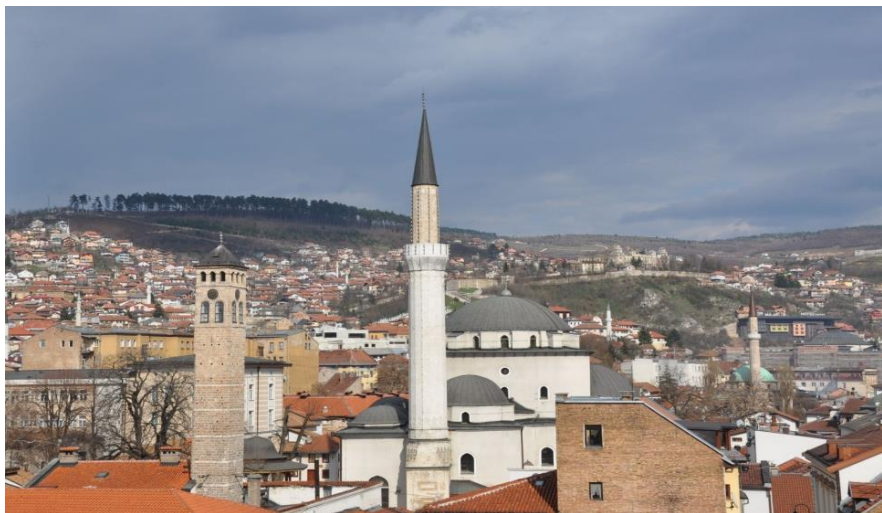
萨拉热窝市中心的贝戈瓦清真寺

波什尼亚克族信仰伊斯兰教，塞尔维亚族信仰东正教，克罗地亚族信仰天主教，犹太少数民族信仰犹太教。伊斯兰教的重要节日有：开斋节、宰牲节；东正教的重要节日有：圣诞节和复活节；圣诞节和复活节是天主教重要的宗教节日。