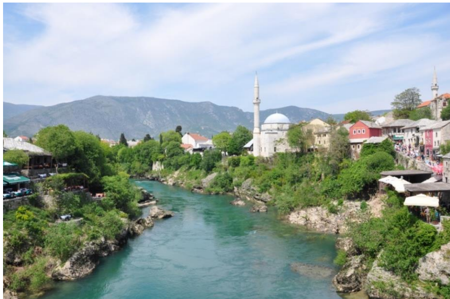
莫斯塔尔市的内雷特瓦河畔风光

其他主要城市有图兹拉（煤电和化工业）、泽尼察（钢铁产业）、多博伊（农业及食品加工）。