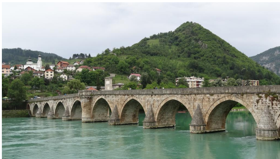
波黑维舍格勒老桥

【旅游产业】波黑将旅游列为经济发展重要产业之一。2018年，波黑旅游人数146.54万人次，同比增长12.1%；过夜天数304万天，同比增长13.5%。其中，2018年有中国游客58,235人次到访波黑，同比增长83.5%，列外国赴波黑旅游人数第5位；过夜天数66,703天，同比增长79.3%。