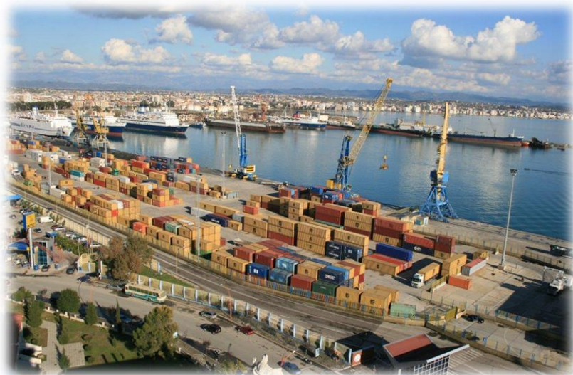
阿尔巴尼亚第一大港口——都拉斯港

阿尔巴尼亚西临亚得里亚海和爱奥尼亚海，海运历来是阿尔巴尼亚与外界往来联系的重要方式。目前阿尔巴尼亚主要有4个港口，从北到南依次为申津港、都拉斯港、发罗拉港和萨兰达港。2018年，阿尔巴尼亚全国港口完成货物吞吐量389万吨，同比下降3.2%；完成旅客吞吐量152.2万人次，同比增长0.9%。