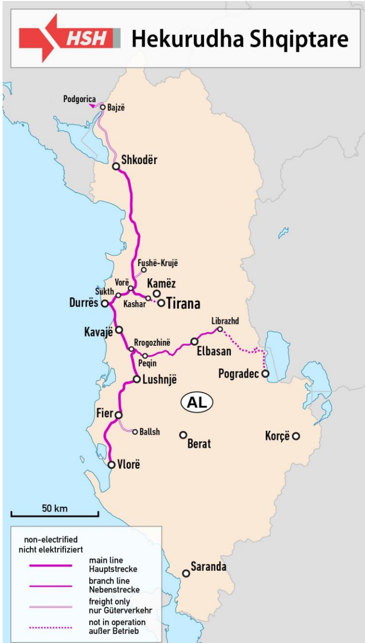
阿尔巴尼亚铁路运输网络图