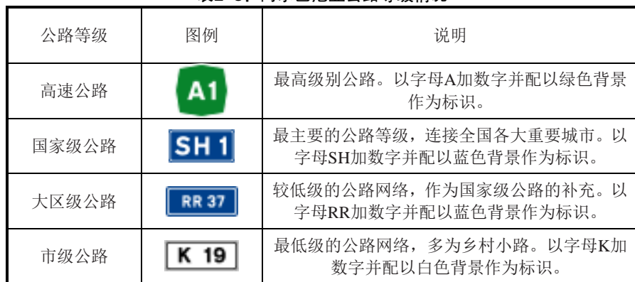
表2-3：阿尔巴尼亚公路等级情况