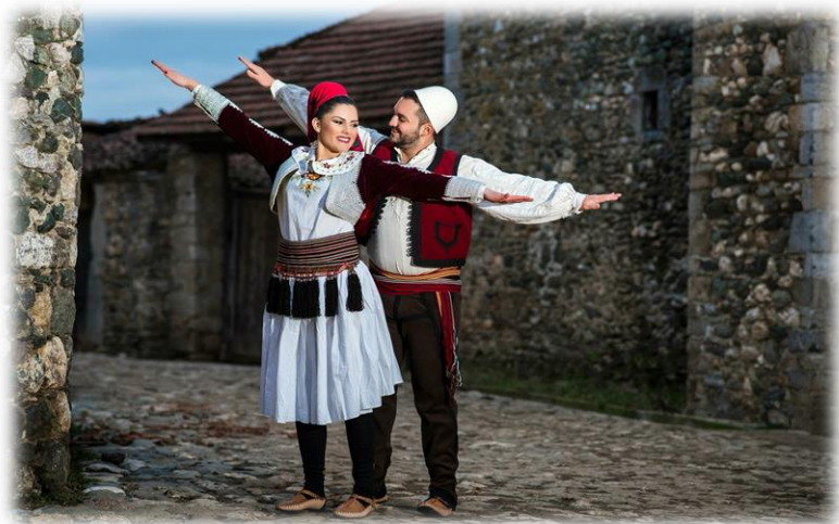
身着传统民族服饰的阿尔巴尼亚族男女

根据阿尔巴尼亚国家统计局公布的最近一次（2011年）全国人口普查结果，阿尔巴尼亚族人占总人口的82.58%。少数民族主要有希腊族（0.87%）、罗姆族（0.3%）、罗马尼亚族（0.3%）、马其顿族（0.2%）等。