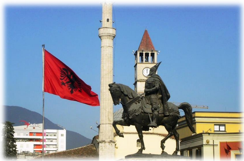
地拉那市中心的斯坎德培塑像

1912年11月28日，阿尔巴尼亚宣布独立。第一次世界大战期间，阿尔巴尼亚被意大利、法国和奥匈帝国割据。1920年，阿尔巴尼亚再次宣布独立。1925年成立共和国，1928年改为君主制，至1939年4月意大利入侵。第二次世界大战期间先后被意大利、德国法西斯占领。1944年11月29日，阿尔巴尼亚全国解放。1946年1月11日，阿尔巴尼亚人民共和国成立，1976年，改为阿尔巴尼亚社会主义人民共和国。1990年，阿尔巴尼亚实行政治体制转轨，1991年4月，改国名为阿尔巴尼亚共和国。根据1998年通过的宪法，阿尔巴尼亚为议会制共和国。2006年6月，阿尔巴尼亚与欧盟签署了《稳定与联系协议》。2009年4月28日，阿尔巴尼亚正式递交入盟申请。2014年6月，阿尔巴尼亚获得欧盟候选国地位。