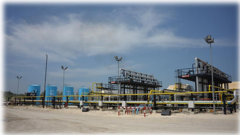
阿尔巴尼亚班克斯油田

【并购项目】截至目前,阿尔巴尼亚大型知名并购项目主要有:中国洲际油气股份有限公司通过上海泖洲鑫科能源投资有限公司收购班克斯石油公司(Bankers Petroleum)、中国光大控股有限公司收购地拉那国际机场(TIA)等。