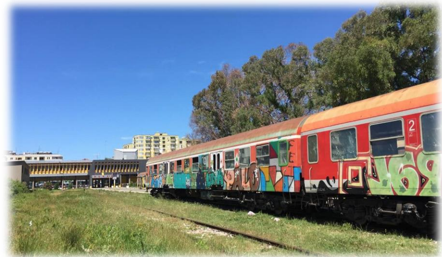
阿尔巴尼亚都拉斯火车站

阿尔巴尼亚目前运营的所有火车均为柴油机车驱动，最高时速55公里，平均时速仅30公里左右。在区域互联互通方面，阿尔巴尼亚仅同北部的黑山有货运列车往来，与周边其他国家和地区均无铁路相连。近年来，阿尔巴尼亚政府一直希望吸引外资帮助其重建铁路交通系统，并制定铁路发展规划。当前，阿尔巴尼亚政府正致力于推动都拉斯到地拉那之间的铁路线路修复，并计划从地拉那新建一条线路通往地拉那国际机场，以进一步促进首都与最大海港、空港之间的人员及货物往来。此外，从波格拉德茨继续向东和东南修建铁路并与马其顿、希腊等周边国家相连，也在阿尔巴尼亚政府的优先项目计划之中。