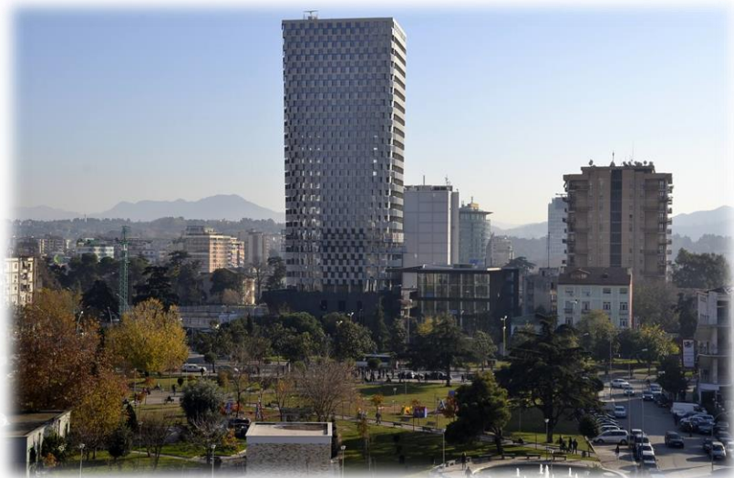
地拉那第一高楼——广场酒店

地拉那是阿尔巴尼亚首都及全国第一大城市，也是阿尔巴尼亚政治、经济、文化中心。地拉那位于阿尔巴尼亚中西部平原，达依特山麓下，距亚得里亚海40公里。海拔110米，气候温暖。市区面积41.8平方公里，人口约80万。始建于1614年，1920年定为首都。1922至1939年是索古王朝所在地。第二次世界大战期间为阿尔巴尼亚民族解放运动的重要中心。地拉那市有多所大学，市内有民族历史博物馆、国家歌舞剧院、国家图书馆、科学院等重要科学文化设施。以民族英雄斯坎德培名字命名的广场坐落在市中心，广场的斯坎德培塑像和古清真寺是地拉那象征性建筑。位于里纳斯镇的地拉那国际机场是全国唯一的民用机场。