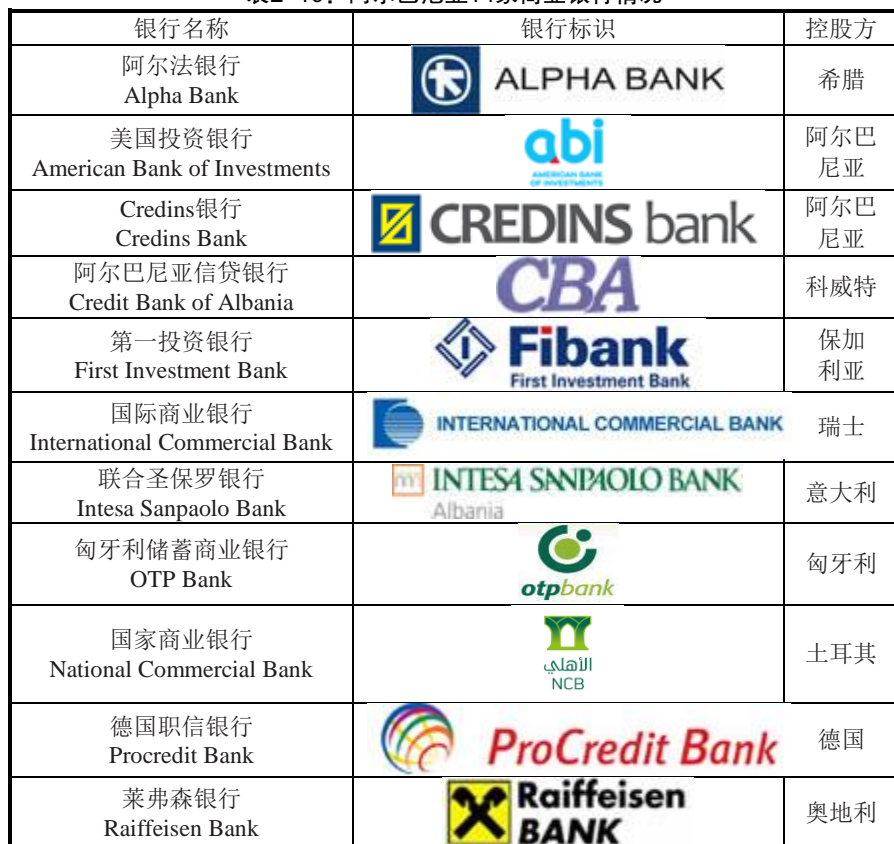
表2-10：阿尔巴尼亚14家商业银行情况