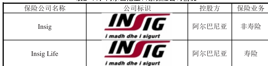
表2-11：阿尔巴尼亚11家保险公司情况

【保险公司】阿尔巴尼亚保险市场主要由寿险、非寿险和再保险三部分组成。据阿尔巴尼亚金融监管局公布数据，截至2018年底，全国共发放12个保险牌照（8个非寿险、3个寿险、1个再保险），涉及11家保险公司。其中，Insig为国有保险公司，其余9家均为私有保险公司。外资控股的保险公司有4家，奥地利保险巨头维也纳保险集团、优尼卡保险集团各持有2家。2017年，阿尔巴尼亚保险市场规模为161.97亿列克（约合1.49亿美元），同比增长4.9%，其中非寿险、寿险、再保险保费收入分别占比92.06%、7.44%、0.5%。2017年，非寿险保费收入为149.11亿列克（约合1.38亿美元），同比增长4.22%。市场份额最大的非寿险公司为Sigal Uniq Group Austria，占比26%；市场份额最大的寿险公司为Sigal Life Uniq Group Austria，占比61%。