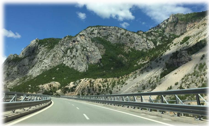
阿尔巴尼亚境内高速公路