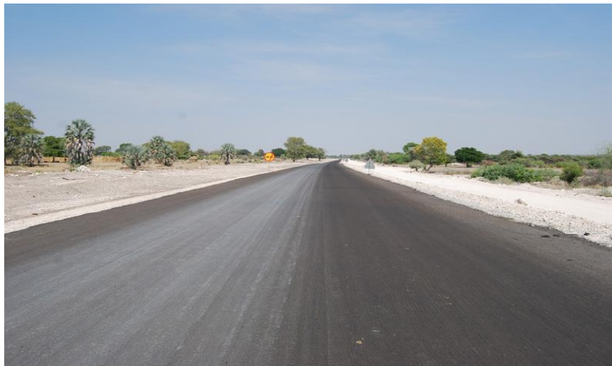
河南国际公司承建的北部公路项目现场