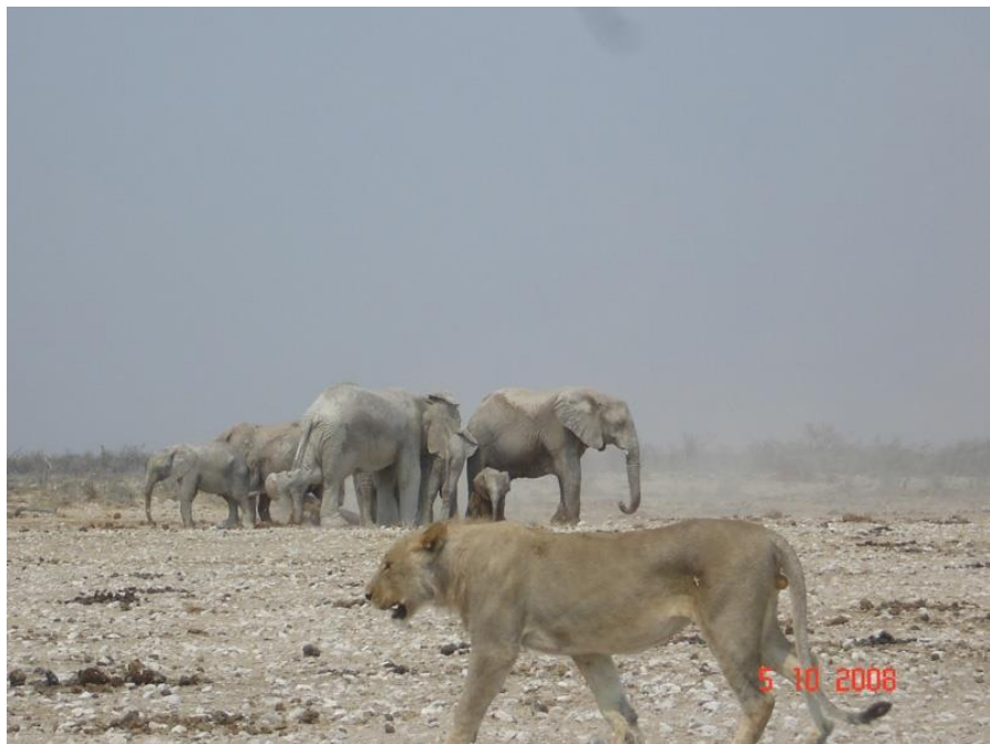
埃托沙野生动物园

纳米比亚位于东2时区，当地时间比格林尼治标准时间早2个小时，比北京时间晚6个小时。纳米比亚没有夏令时。