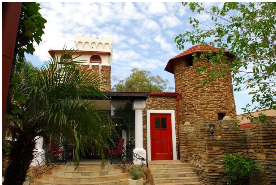
温得和克的城堡餐厅