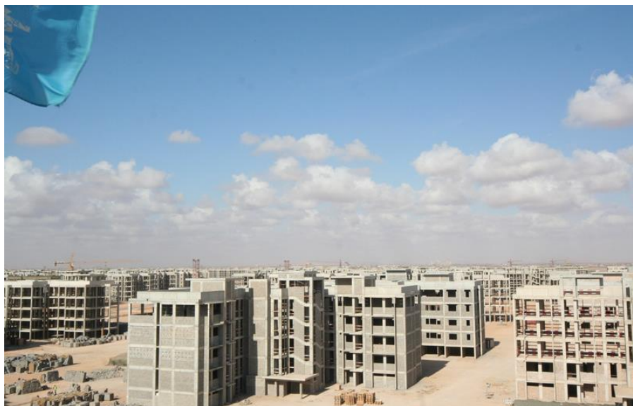
中建利比亚班加西富德15000套住宅工程施工现场

据中国商务部统计，2017年中国企业在利比亚新签承包工程合同2份，新签合同额3万美元，完成营业额5117.99万美元；累计派出各类劳务人员96人，年末在利比亚劳务人员134人。2016年中国企业在利比亚新签承包工程合同5份，新签合同额3643万美元，完成营业额3205万美元；当年派出各类劳务人员142人，年末在利比亚劳务人员249人。新签大型工程承包项目包括中兴通讯股份有限公司承建LIBNA运维四期项目等。2018年，中国企业在利比亚新签承包工程合同0份，新签合同额0美元，完成营业额107万美元；累计派出各类劳务人员9人，年末在利比亚劳务人员90人。