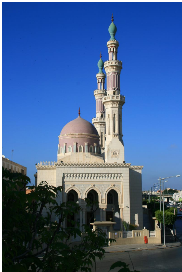
利比亚穆罕默德清真寺

伊斯兰教是国教。逊尼派穆斯林信众占96.6%，基督教占2.7 %，佛教占0.3%。