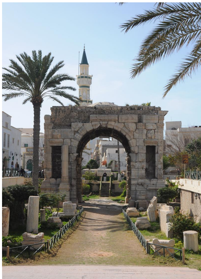
的黎波里市中心古城清真寺

利比亚民风古朴，受伊斯兰教影响较深，忌讳与女性单独交谈，除一般违禁品外，酒、猪肉等禁止携入境。社会阶级意识不强烈，见面时不分阶级皆以握手为礼。与官方机构往来函件必须使用阿拉伯文。在利比亚安排会晤要尽量提前，并准时到达。利比亚人对时间的运用很灵活，并不受时间表安排约束。利比亚烹饪融合了阿拉伯和地中海的烹饪风格，并深受意大利菜肴影响。但目前社会安全局势不稳，有少数青年饮酒吸毒。