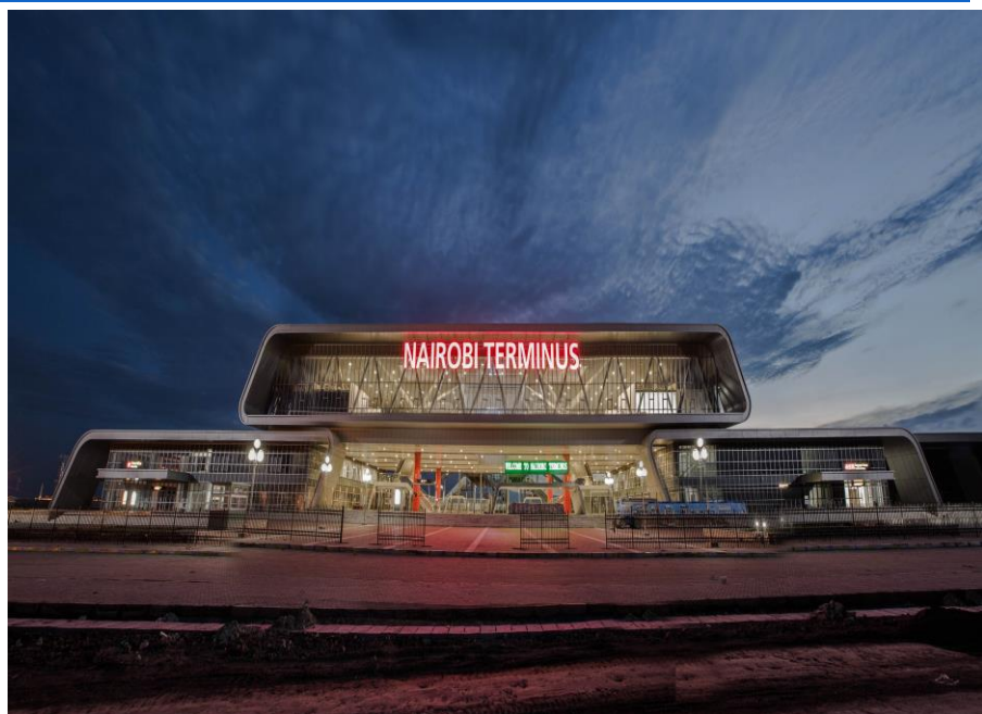
中国路桥蒙内铁路内罗毕终点站

【承包劳务】据中国商务部统计，2018年中国企业在肯尼亚新签承包工程合同140份，新签合同额37.89亿美元，完成营业额43.53亿美元；累计派出各类劳务人员4831人，年末在肯尼亚劳务人员9131人。新签大型工程承包项目包括水电国际工程承包肯尼亚内罗毕东环和北环公路扩建项目；中国路桥工程有限责任公司承包中交蒙巴萨港新建KOT工程项目；中国电力技术装备有限公司承包肯尼亚蒙巴萨-内罗毕沿线经济带及铁路供电项目等。