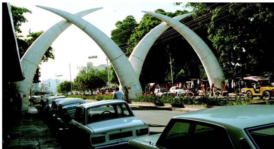
肯尼亚蒙巴萨市中心