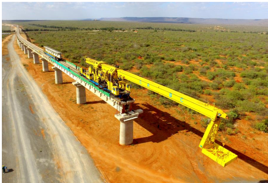
中国路桥蒙内铁路项目架梁施工