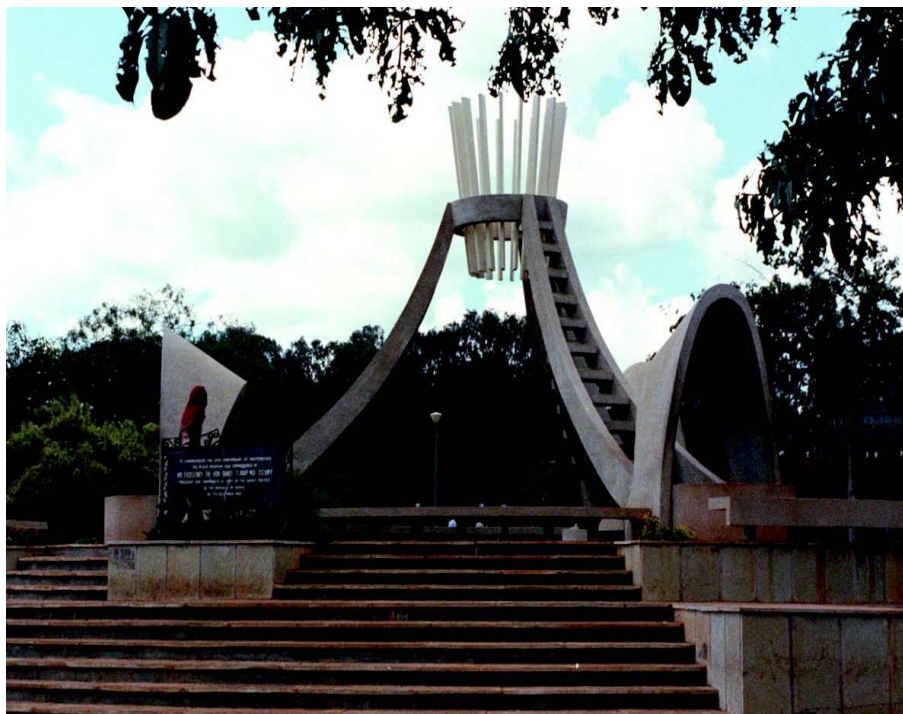
肯尼亚独立纪念碑

【总统和内阁】肯尼亚实行总统内阁制，总统为国家元首、政府首脑兼武装部队总司令，由直接普选产生，每届任期5年。2017年11月28日，乌胡鲁·肯雅塔宣誓就职，成功连任。内阁由总统和总统任命的副总统、各部部长以及总检察长组成。本届内阁成立于2018年2月，由总统、副总统、各部部长共24名成员组成。