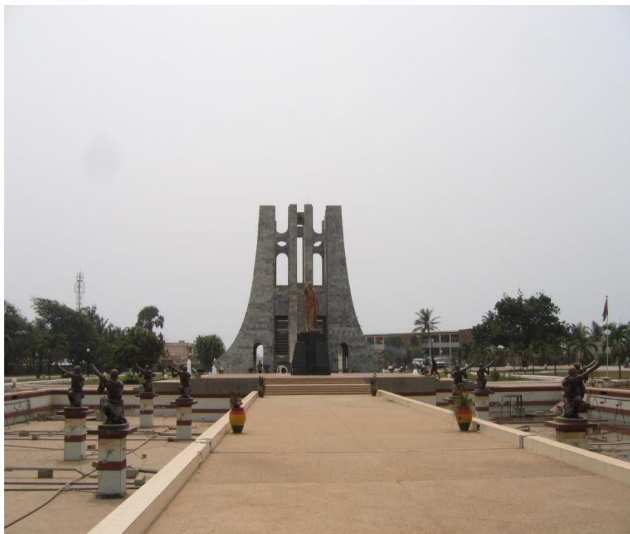
加纳标志性的名胜古迹——恩克鲁玛陵园

加纳海岸线长562公里，沃尔特河贯穿南北，渔业资源丰富。加纳森林覆盖面积约495万公顷，占国土面积的22%。