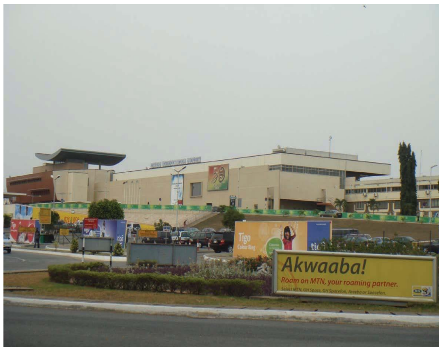
加纳科托卡国际机场

司也有从北京、上海、广州、成都出发经停亚的斯亚贝巴到阿克拉的航线，也可从荷兰、英国、埃及、土耳其、肯尼亚、南非等国中转往返北京和阿克拉。