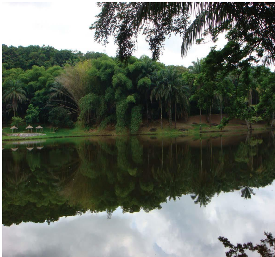
山谷湖（lac de Ma_Vallée）