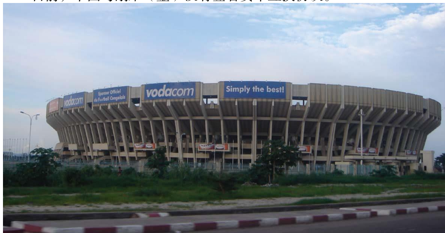
中国援建的金沙萨烈士体育场

【经援合作】自1972年11月24日中刚两国关系正常化以来，中国政府向刚果（金）政府提供了力所能及的经济援助，在农业、医疗卫生和基础设施等领域开展了友好合作，建设了政府综合办公楼、人民宫、体育场、医院、小学校、农业合作等项目。近年来，双方在人力资源培训方面亦取得良好成果，为促进刚果（金）经济社会发展发挥了积极作用，受到刚果（金）政府和人民的好评。