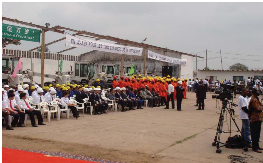
中国中铁及中水集团在刚果（金）大型合作项目开工仪式

【承包劳务】近年来，中国工程承包企业已在刚果（金）市场打开了局面，承揽的工程项目主要涉及修路、水电站建设、供水工程及电信设施建设等。