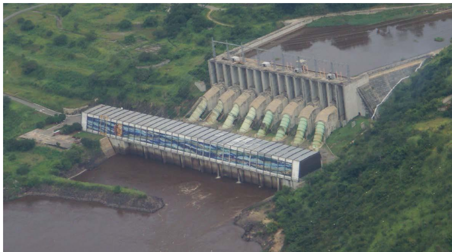
位于刚果河下游的英加水电站（Ingá）鸟瞰