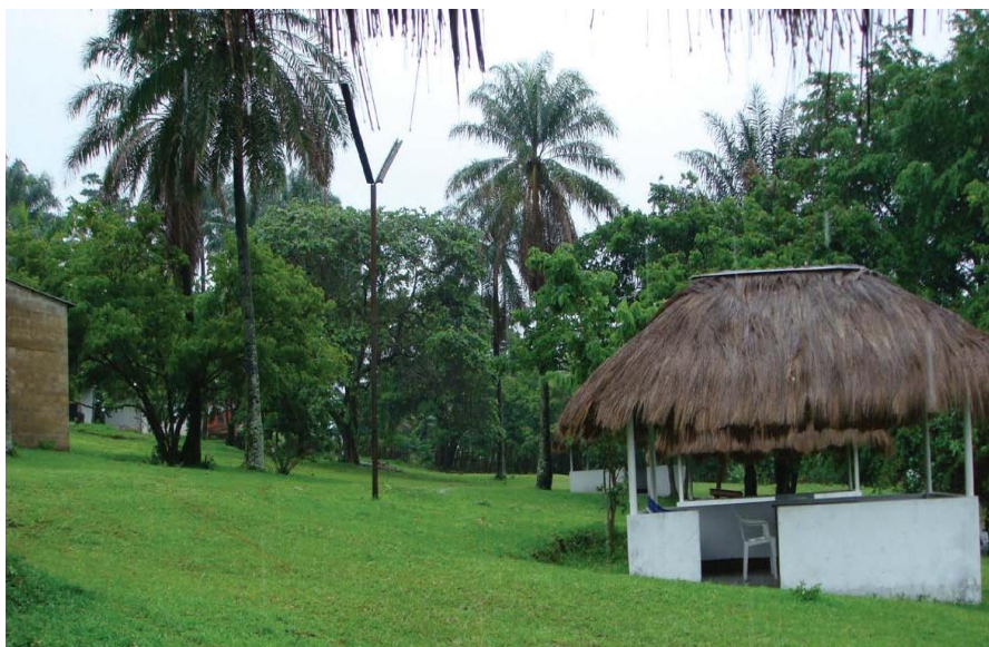
位于金沙萨郊区刚果河畔的旅游景点马鲁谷（Maluku）