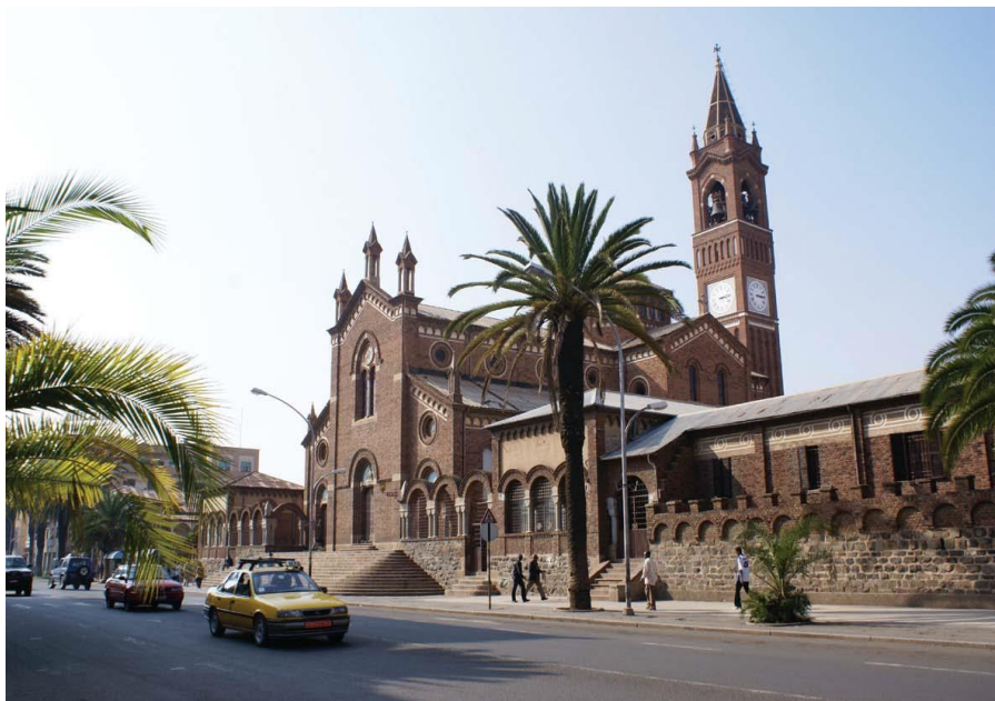
阿斯马拉主街上的天主教教堂