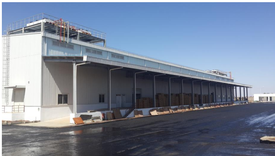
上海外经实施的涉农冷库

(2) 2014年,四川路桥投资3000万美元与厄合资成立克尔克贝特矿业(Kerkebet)公司,目前主要进行勘探工作。勘查区位于厄立特里亚国安塞巴区克尔克贝特一带,距离首都阿斯马拉西约350~400公里。2015年初已取得超过3万份检验分析样品。正分批送往中国进行检验。该公司于2016年4月以6500万美元收购加拿大Sunrize公司在阿斯马拉矿的60%股权,目前正开展矿区开发建设的融资、管理层架构等工作。