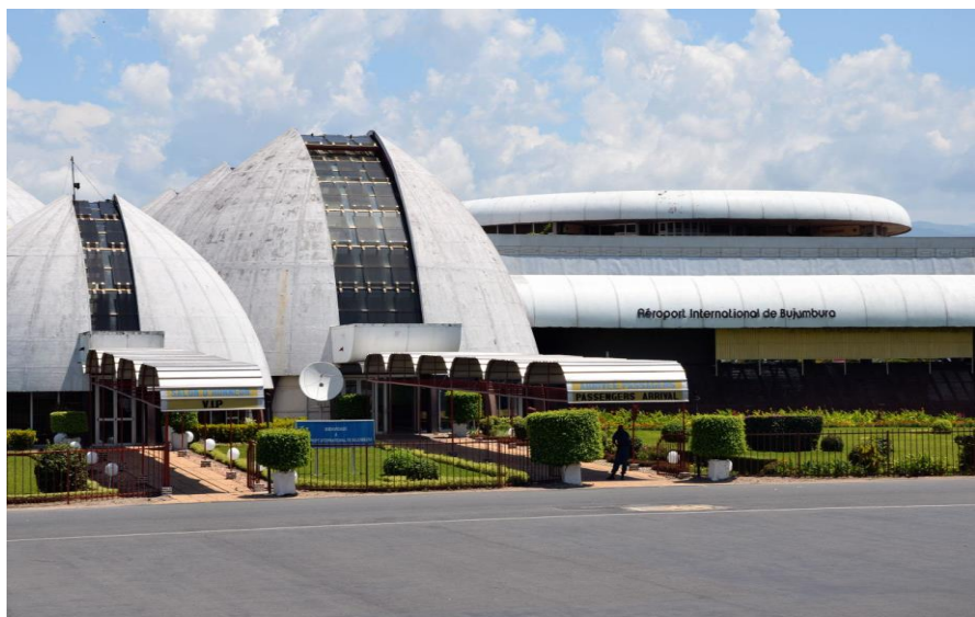
布隆迪布琼布拉国际机场

返回达累斯萨拉姆，往返中途均停靠基戈马。中国去往布琼布拉一般需经埃塞俄比亚首都亚的斯亚贝巴，或者肯尼亚首都内罗毕等地中转。