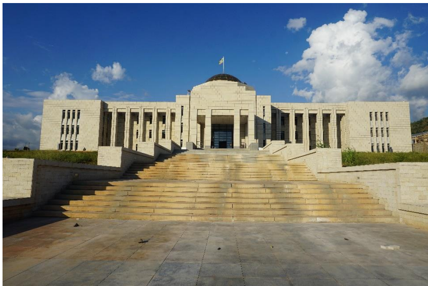
援布隆迪总统府项目（湖南建工承建）

所有可能为布隆迪政府提供资金的援助行动，但保留对布方人道主义援助和与当地非政府组织直接合作的项目。同时，欧盟方面称将继续保持与布隆迪政府的对话渠道，并根据布隆迪国内各派政治对话的具体实施和有关进展，每隔六个月审议一次该制裁措施。继比利时、荷兰、美国决定停止对布隆迪援助后，欧盟这一决定无疑将严重打击布隆迪经济发展。