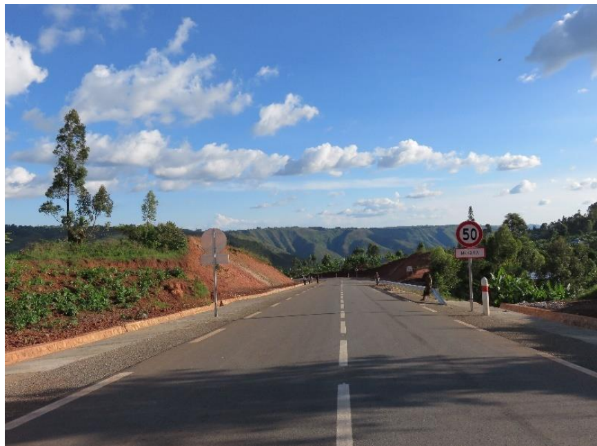
三号国道项目（中水电十三局承建，2017年落成）