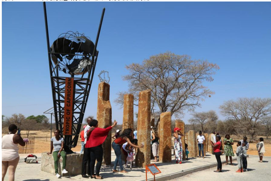
博茨瓦纳南回归线景点

企业要充分考虑项目实施过程中可能遇到的环保问题，做好环保预案，一旦出现紧急情况，及时启动预案。