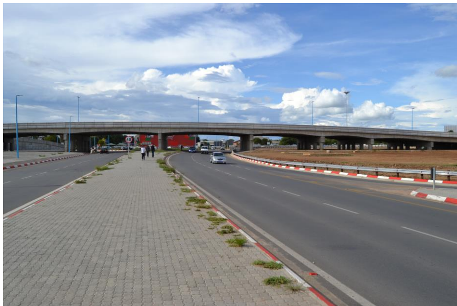
中铁七局集团博茨瓦纳有限公司Tonota-Francistown A1道路升级项目