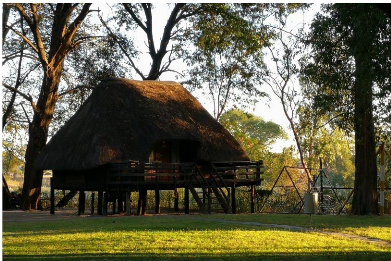
博茨瓦纳弗朗西斯敦马兰酒店

2015年6月，博议会通过2015年经济特区法案（Special Economic Zones Bill 2015），该法案明确将设立经济特区管理局（Special Economic Zones Authority, BSEZA），以统筹管理、协调博经济特区政策实施。该机构正式成立前，由博投资与贸易中心暂代行其职能。