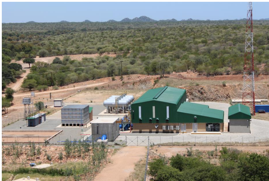
中国建筑工程总公司博茨瓦纳有限公司迪卡通大坝工程输水管线及配套项目