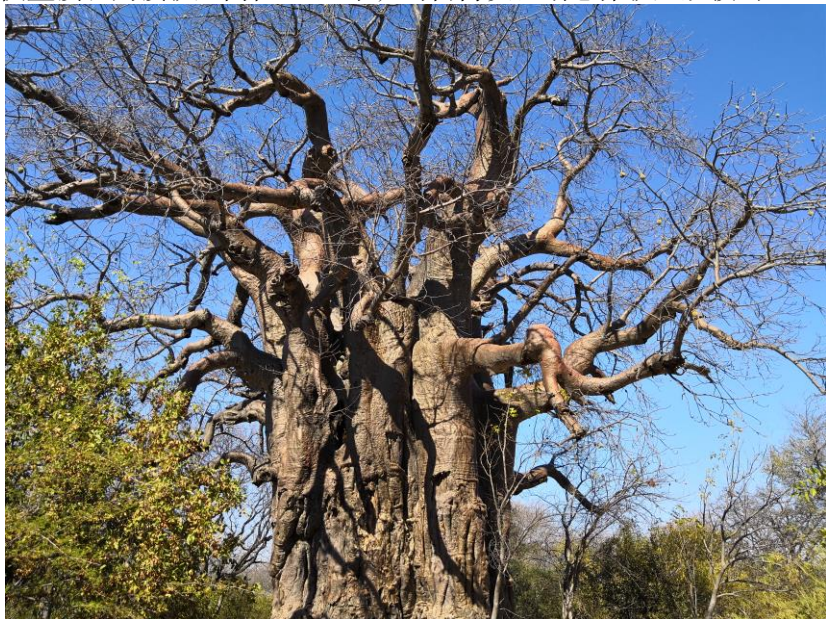
博茨瓦纳猴面包果树

【旅游业】博茨瓦纳是非洲主要旅游国之一，旅游资源丰富，是非洲野生动物种类和数量较多的国家。政府把全国38%的国土划为野生动物保护区，设立了3个国家公园、5个野生动物保护区。乔贝国家公园和奥卡万戈三角洲野生动物保护区为主要旅游点。旅游业现为博茨瓦纳第二大外汇收入来源，是经济多元化战略的重点发展产业。为促进旅游业的发展，2005年博茨瓦纳成立了旅游董事会。旅游业已为博茨瓦纳直接和间接提供了10%的就业机会。根据世界旅行旅游理事会的数据，2017年博茨瓦纳旅游业产值为71.3亿普拉（6.9亿美元），对博茨瓦纳经济直接贡献率达3.6%，提供直接和间接就业岗位7.6万个，约占博茨瓦纳总体就业规模的7.6%。