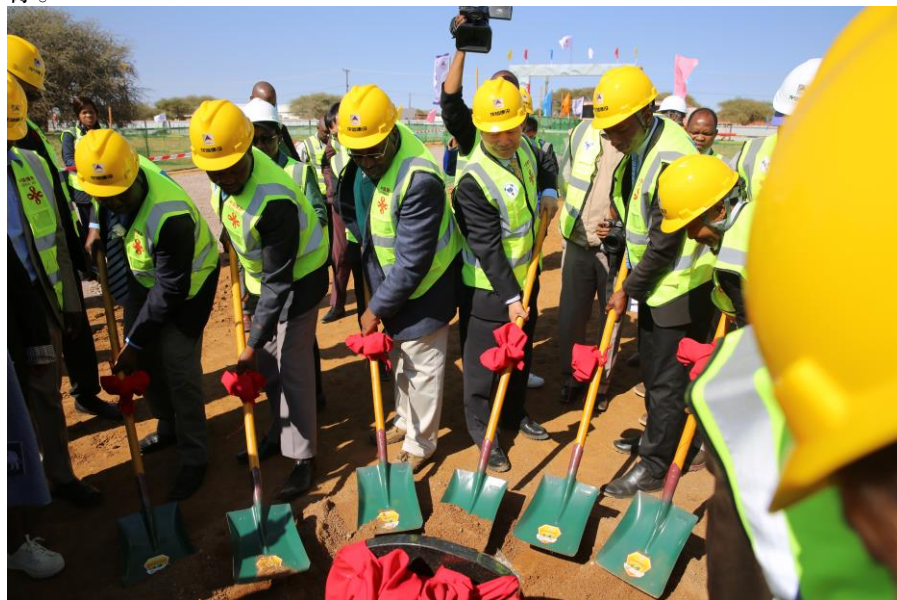
中国援博茨瓦纳莫帕尼小学项目开工仪式