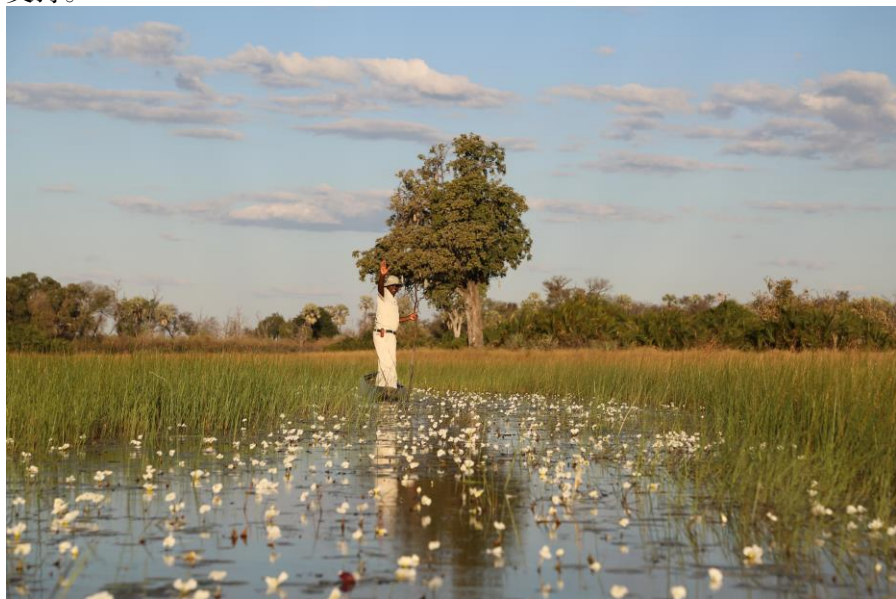
博茨瓦纳奥卡万戈三角洲

遇有突发事件，应及时向中国驻博茨瓦纳大使馆、公司总部或派出单位所在地商务主管部门报告，并及时与博茨瓦纳相关政府部门联系，寻求支持。