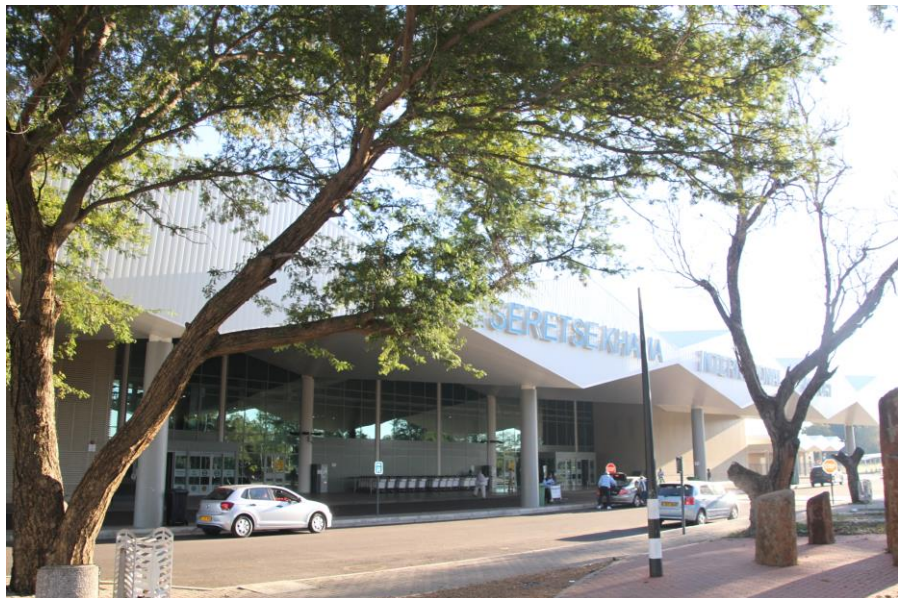
博茨瓦纳哈博罗内卡玛国际机场