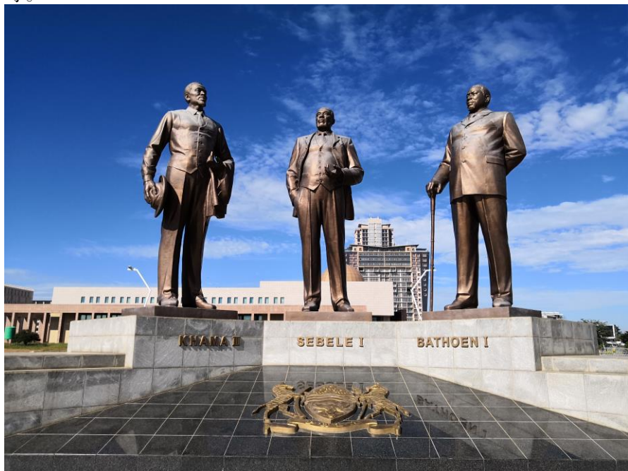
博茨瓦纳领袖铜像

博茨瓦纳注册的主要政党民主党（Botswana Democratic Party）、民族阵线党（Botswana National Front）、大会党（Botswana Congress Party）、人民党（Botswana People's Party）、民主运动党（Botswana Movement for Democracy）、进步联盟党（Alliance for Progressives）等。