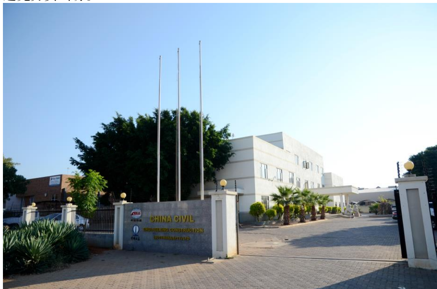
中国土木工程集团博茨瓦纳有限公司

执行有关劳动保护、辞退、休假等方面的法律规定。中国企业到博茨瓦纳投资应熟悉有关劳动政策法律，详细核算人工成本，慎重签署雇佣合同，避免劳资纠纷。