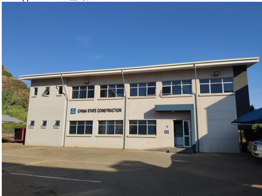
中国建筑工程总公司博茨瓦纳有限公司

博茨瓦纳政府采购和资产处置委员会发布招标项目和中标等相关信息，亦可通过当地报纸刊登的政府项目招标公告了解信息，或登陆 www.ppadb.co.bw 查询。