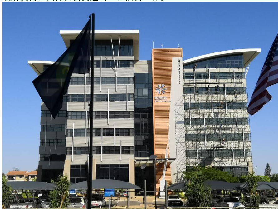
博茨瓦纳投资贸易中心

2012年6月，博茨瓦纳投资贸易中心（Botswana Investment and Trade Centre）正式挂牌成立。该中心由原博茨瓦纳国际金融中心（IFSC）与博茨瓦纳出口发展与投资局（BEDIA）合并而成，为独立的准政府机构，具体负责促进出口和投资工作。