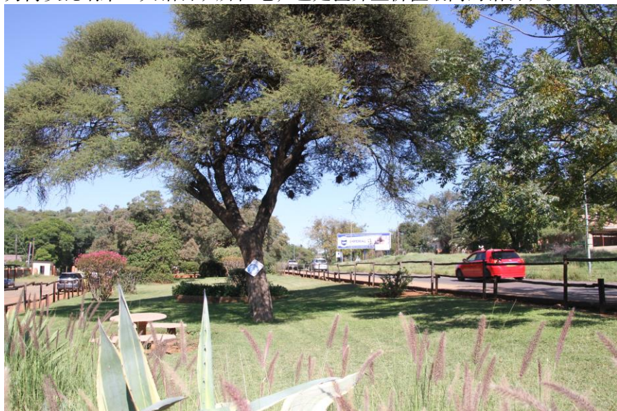
博茨瓦纳洛巴策街景

吉瓦嫩（Jwaneng），位于博茨瓦纳南部地区，主要是钻石开采业，为博茨瓦纳第一大钻石矿所在地，也是世界上价值最高的钻石矿。