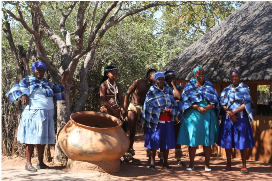
博茨瓦纳巴乌路策民俗村

博茨瓦纳实行宗教自由政策，居民多数信奉基督教和天主教，部分居民信奉伊斯兰教、巴哈教，农村地区一些居民信奉非洲传统宗教。