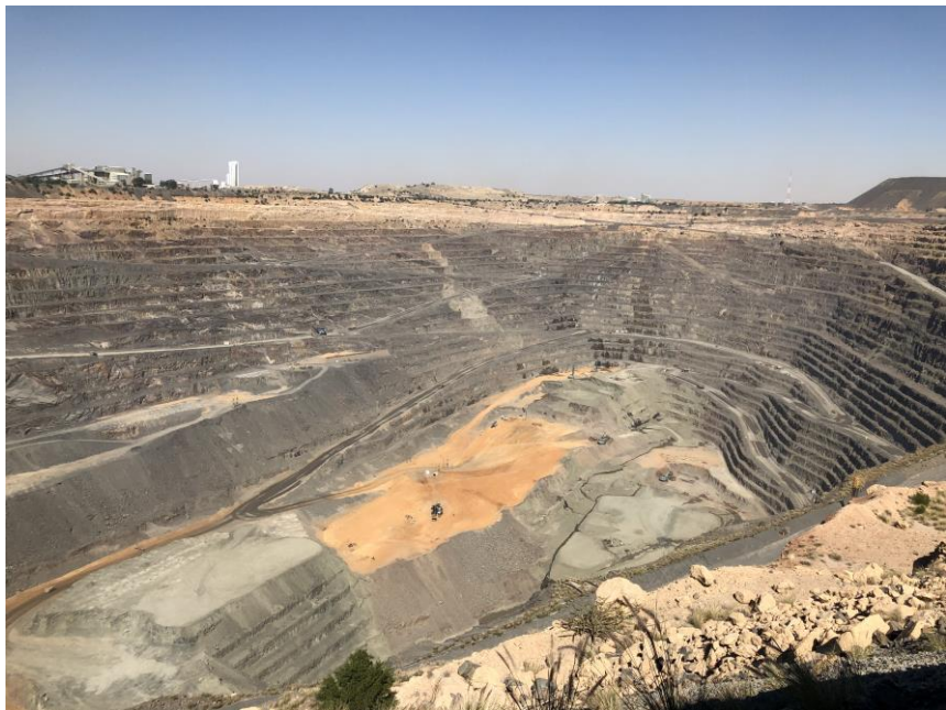
博茨瓦纳吉瓦嫩钻石矿