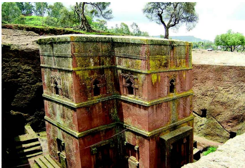
拉里贝拉岩石教堂

埃塞俄比亚居民中45%信奉埃塞俄比亚正教（基督教一性论教派），40%-45%信奉伊斯兰教，5%信奉新教，其余信奉原始宗教。