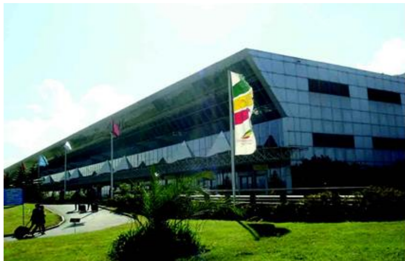
亚的斯博莱国际机场

中国至埃塞俄比亚的航线主要由埃塞俄比亚航空公司和阿联酋航空公司运营，其中，埃塞俄比亚航空公司运营北京—亚的斯亚贝巴、广州—亚的斯亚贝巴、上海—亚的斯亚贝巴、成都—亚的斯亚贝巴和香港—亚的斯亚贝巴航线；阿联酋航空公司运营北京—亚的斯亚贝巴、上海—亚的斯亚贝巴和香港—亚的斯亚贝巴航线。每周有33个航班往返于埃塞和中国。