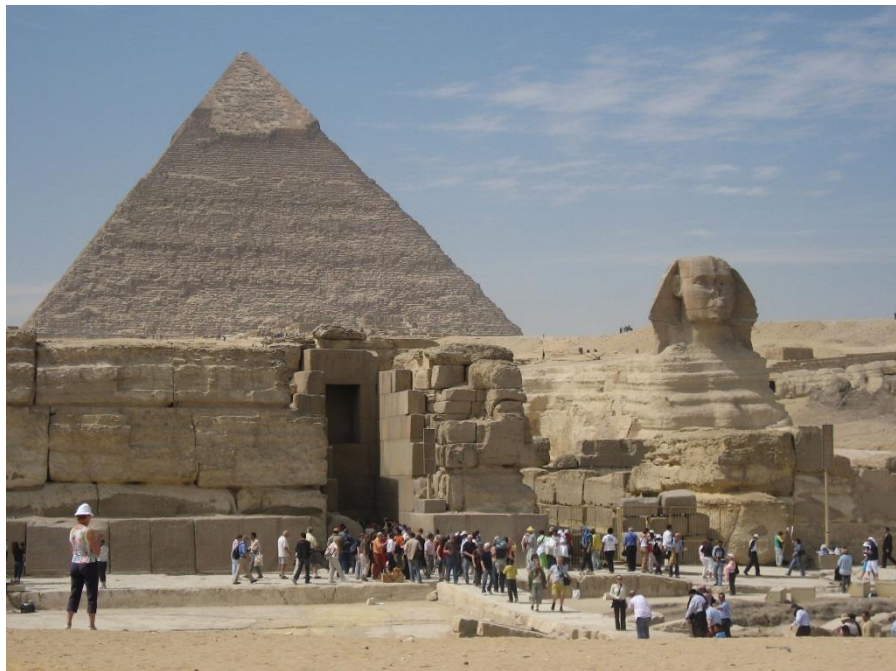
金字塔和狮身人面像

埃及是世界四大文明古国之一。公元前3200年，美尼斯统一埃及建立了第一个奴隶制国家，此后经历了早王国、古王国、中王国、新王国和后王朝时期，共30个王朝。古王国开始大规模建金字塔。中王国经济发展、文艺复兴。新王国生产力显著提高，开始对外扩张，成为军事帝国。后王朝时期，内乱频繁，外患不断，国力日衰。公元前525年，埃及成为波斯帝国的一个行省。在此后的一千多年间，埃及相继被希腊和罗马征服。公元641年，阿拉伯人入侵，埃及逐渐阿拉伯化，成为伊斯兰教一个重要中心。1517年被土耳其人征服，成为奥斯曼帝国的行省。1882年英军占领后成为英国“保护国”。