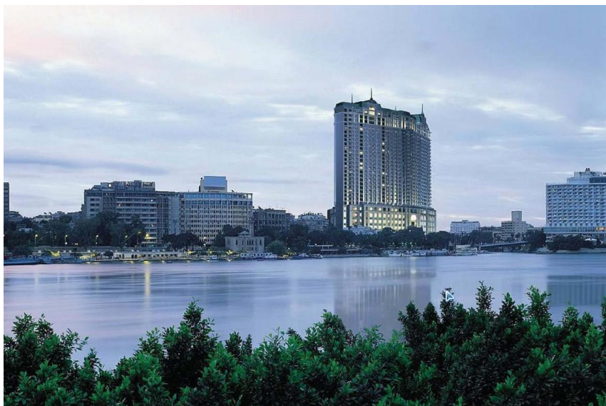
标志性建筑——开罗四季酒店