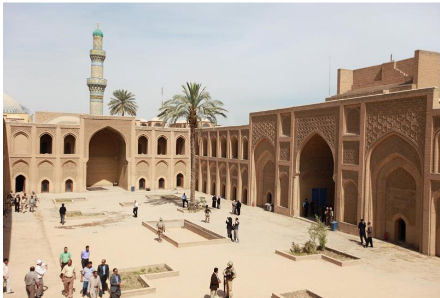
巴格达穆斯坦西里亚大学

【文化】悠久的历史造就了伊拉克灿烂的文化。如今，伊拉克境内古迹遍布，底格里斯河沿岸的塞琉西亚、尼尼微、亚述等均是伊拉克著名的古城。位于巴格达西南90公里的幼发拉底河右岸的巴比伦是与古代中国、印度和埃及齐名的人类文明发祥地，盛传的“空中花园”被列为世界七大奇迹之一。已有1000多年历史的伊拉克首都巴格达更是其辉煌文化的缩影。早在公元8世纪至13世纪，巴格达就成为西亚和阿拉伯世界的政治经济中心和文人、学士荟萃之地。