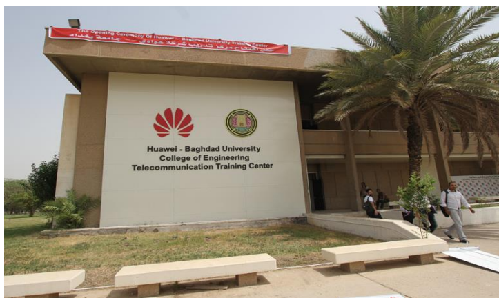
华为-巴格达大学电信培训中心

伊拉克移动用户发展非常迅速，现有的GSM运营商是：ASIACELL、ZAIN、KORAK及部分地方运营商，用户总数约 3480 万。中国华为技术有限公司和中兴通讯有限公司在伊拉克设有分公司。