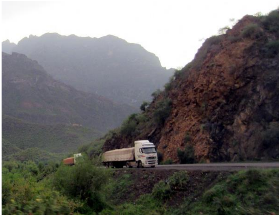
中国援建的荷台达-萨那公路

迈德，就也门问题深入交换了看法。2017年9月7日，驻也门大使田琦在利雅得会见也门总统哈迪，强调中方支持政治解决也门问题，支持联合国及联合国秘书长也门问题特使的斡旋努力，希望也门尽快恢复和平，中方愿积极参与也门未来战后经济重建，与也方携手推进“一带一路”建设，造福两国人民。2018年7月11日，国务委员兼外交部长王毅在北京同来华出席中国-阿拉伯国家合作论坛第八届部长级会议的也门外交部长耶曼尼举行会谈。