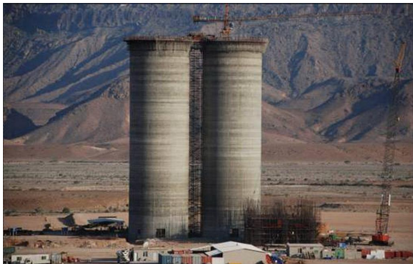
中材国际工程股份有限公司承建也门穆卡拉AYCC水泥厂项目

【承包工程】据中国商务部统计，2018年中国企业在也门新签承包工程合同10份，新签合同额1237.00万美元，完成营业额1134.00万美元；年末在也门劳务人员21人。新签大型工程承包项目包括华为技术有限公司承包也门电信等。