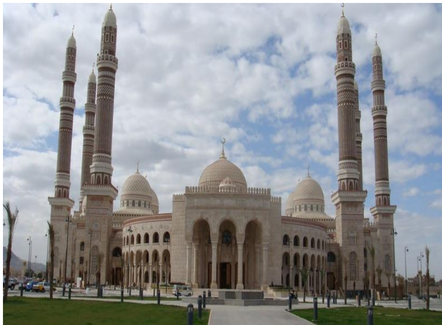
雄伟壮丽的萨利赫总统清真寺

伊斯兰教众每天5次祈祷，由教长通过高音喇叭“唤礼”，颂诵“古兰经”，表示虔诚。教众对公历星期五（回历礼拜天）的礼拜活动非常重视，不论男女老少都前往附近的清真寺跪拜祷告。也门作为正统的穆斯林国家，禁止销售和饮用各类酒，不吃猪肉，禁止对也门女人拍照。