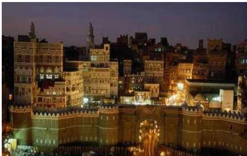
萨那老城（又称也门门）

也门水资源紧缺，主要依靠地下水。近年来，一些地方由于过度开采地下水，水资源紧张的趋势进一步加剧。