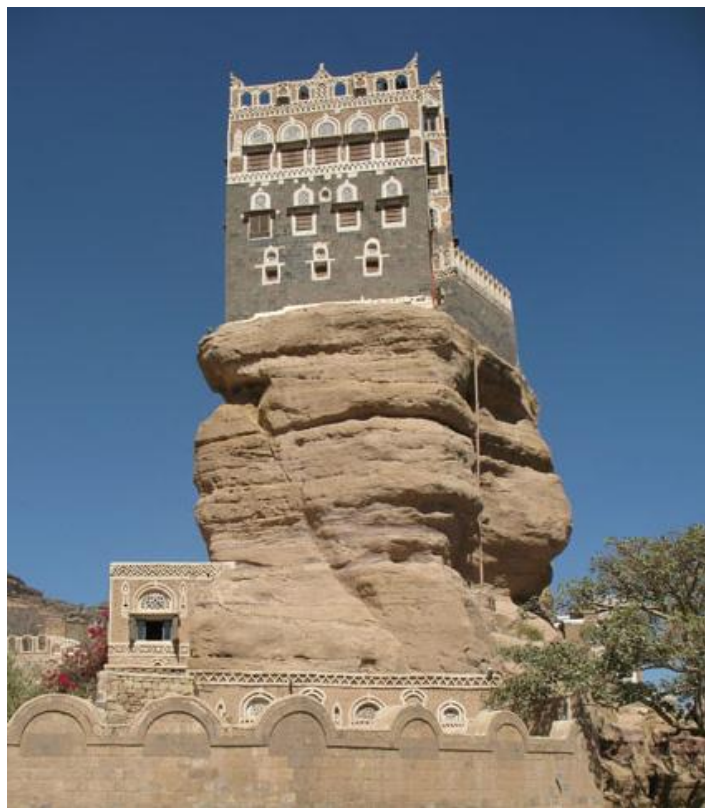
叶海亚王宫（又称石头宫）

也门是阿拉伯半岛人口最多的国家，世界银行数据显示，截至2018年底，也门人口约2850万人；城市人口和农村人口分别占总人口的36.64%和63.36%；城市人口和农村人口增长率分别为4.1%和1.37%。2018年，首都萨那人口277.9万人，占也门城市人口的26.6%。除首都萨那外，人口集中的省份还有亚丁、塔兹、荷台达和伊卜。