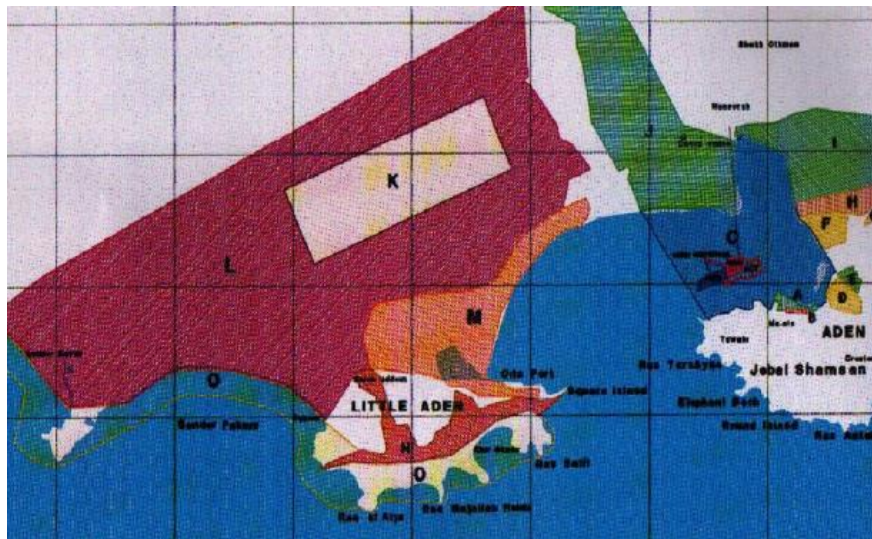
亚丁自由区功能分区图