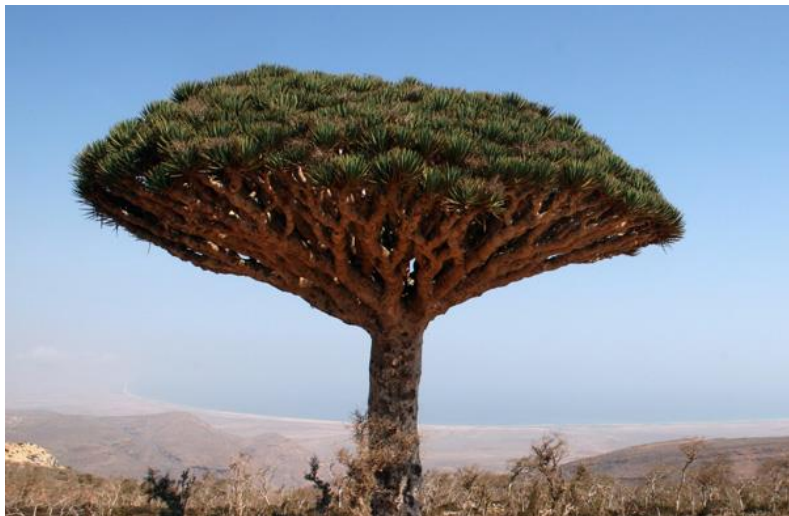
索科特拉岛特有树种——龙血树

也门有悠久的古代文明、丰富的文化遗产和杰出的建筑作品。据联合国教科文组织统计，也门有索科特拉岛等四处古迹或景区被列为世界文化遗产。“四五”规划将旅游业对GDP的贡献率从3.5%上调到4.75%，目标是吸引更多海湾国家的游客。政府将投入540万美元用于解决安全方面的问题。