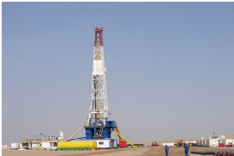
中石化国勘也门分公司投资的ABYE-1号钻探井

【承包工程】据中国商务部统计，2018年中国企业在也门新签承包工程合同10份，新签合同额1237.00万美元，完成营业额1134.00万美元；年末在也门劳务人员21人。新签大型工程承包项目包括华为技术有限公司承包也门电信等。