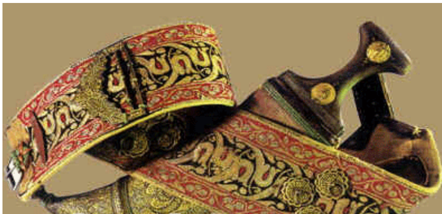
精美的也门传统服饰和腰刀