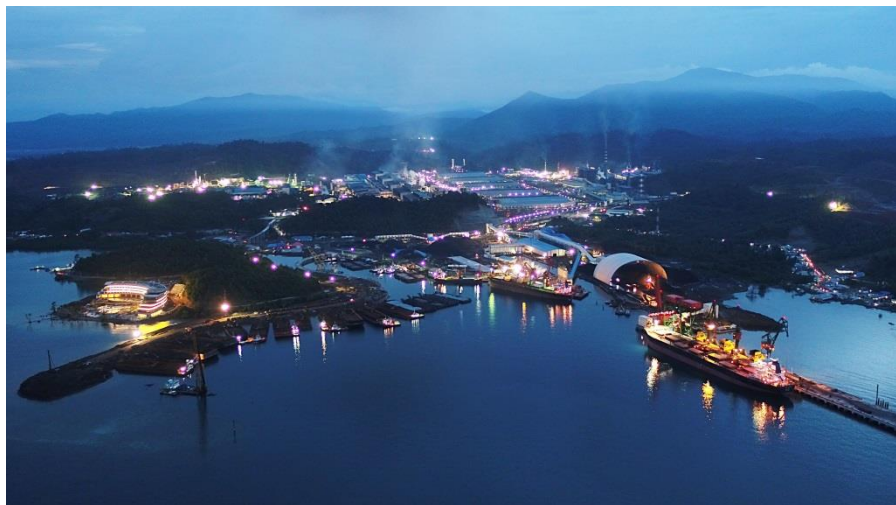
中国企业在印尼投资的青山工业园