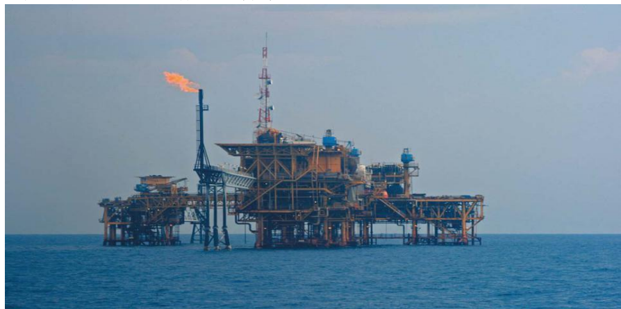
中海油在印尼的作业平台

【投资】据中国商务部统计，2018年当年中国对印度尼西亚直接投资流量18.65亿美元。截至2018年末，中国对印度尼西亚直接投资存量128.11亿美元。到印尼寻求投资合作的中国企业不断增多，涉及领域日益广泛，大型投资项目不断涌现，中国对印尼投资主要领域包括矿冶、农业、电力、地产、家电与电子和数字经济等。