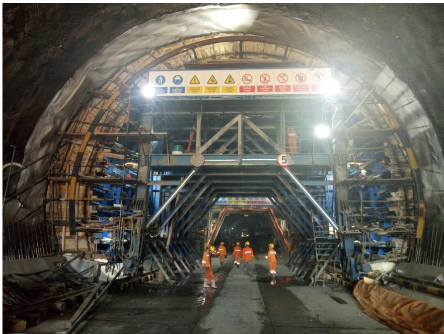
雅万高铁施工现场