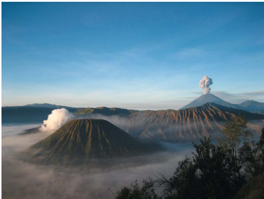
印尼著名的活火山—BROMO火山

产品,其中棕榈油产量居世界第一,天然橡胶产量居世界第二。富含石油、天然气以及煤、锡、铝矾土、镍、铜、金、银等矿产资源。矿业在印尼经济中占有重要地位,产值占GDP的10%左右。据印尼官方统计,印尼石油已探明储量约97亿桶(13.1亿吨),天然气储量4.8-5.1万亿立方米,煤炭已探明储量193亿吨,潜在储量可达900亿吨以上。