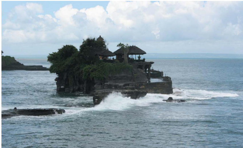
巴厘岛著名景点——海神庙

【同欧洲国家的关系】印尼视欧盟为重要战略伙伴，双方成功举行了印尼—欧盟对话，就民主、人权、地区贡献、多边主义、恐怖主义等议题达成广泛共识。欧盟及西欧各国为印度尼西亚海啸灾难提供大量援助。2013年1月，欧盟代表团访问印尼期间同众议院代表会谈时表示，欧盟视印尼为东盟主要的贸易伙伴，欧盟同印尼不存在竞争关系，反而在贸易上互补，因此欧盟将一如既往地发展同印尼的贸易关系。2016年4月，印尼总统佐科访欧，双方就印尼—欧盟全面经济伙伴关系协定所涉及范畴达成共识，计划于2019年完成谈判并签署协议。