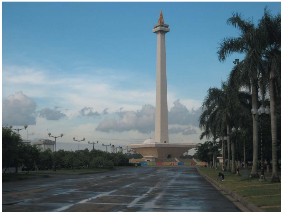
印尼独立纪念碑广场

【政府】实行总统制，总统既是国家元首，也是政府首脑，同时掌管三军。总统、副总统均由全民直选产生，任期5年，总统可连任一次。现任总统佐科·维多多，2014年10月通过直选担任新一届总统，副总统为优素夫·卡拉，任期至2019年。本届内阁于2014年10月组建，2015年8月改组，2016年7月第二次改组，2018年1月第三次改组。