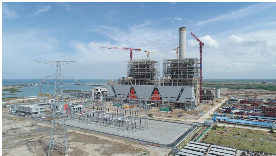
神华国华印尼爪哇7号项目

【货币互换】2018年11月，中国人民银行与印度尼西亚央行续签了双边本币互换协议，旨在便利两国贸易和投资，维护金融市场稳定。协议规模为2000亿元人民币/440万亿印尼盾，协议有效期三年，经双方同意可以展期。