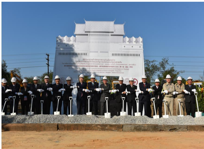
中泰高铁正式开工仪式

此外，由曼谷搭火车到马来西亚，日夜都有定期班车，无论是特快或普快，都有冷气设备。曼谷至吉隆坡，需时约40小时。曼谷至新加坡，需时约46小时左右。