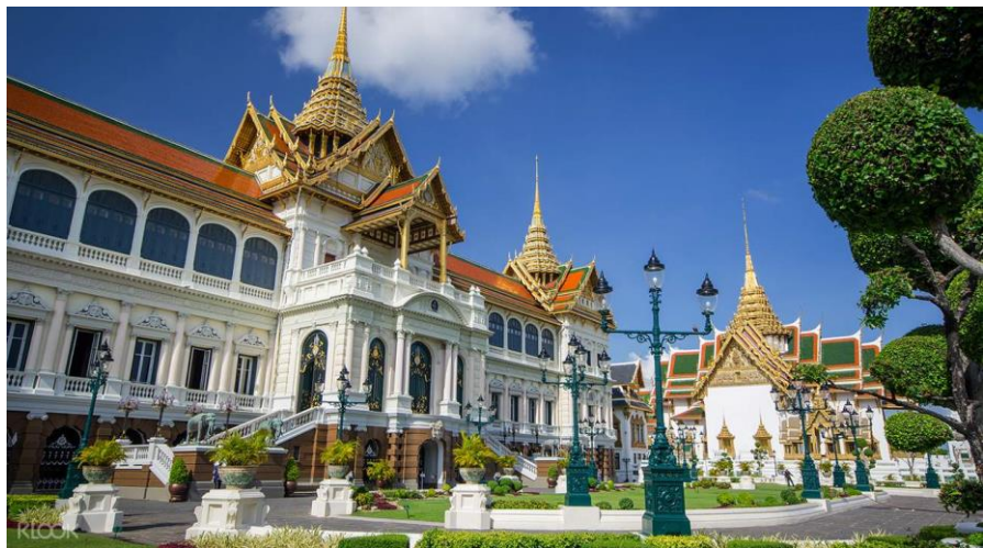
泰国著名景点——大皇宫

泰国全国大部分地区属热带季风气候，全年明显分为热季（2-5月中旬）、雨季（6-10月中旬）和凉季（11-翌年2月）3个季。全年平均气温27.7℃，最高气温可达40℃以上。年平均降水量为1100毫米。平均湿度为66%-82%。