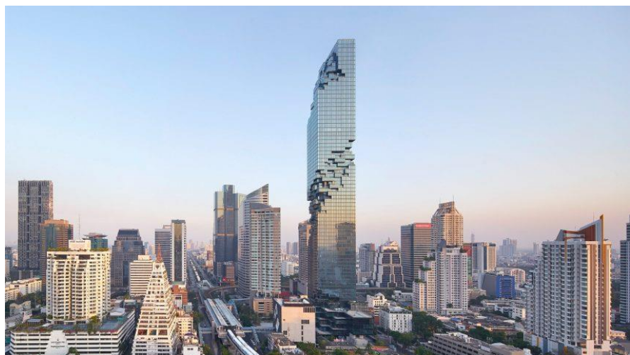
泰国最高建筑——曼谷大都会大厦

泰国第二大城市清迈是泰国著名的历史文化古城，建于 1296 年，是泰国北部政治、经济、文化教育中心，距曼谷 700 公里，位于海拔 300 米的高原盆地，作为兰纳王朝的首都，其所建城垣大多保存至今。清迈府总面积 3905 平方公里，人口约 174.7 万；首府清迈市面积 40 平方公里，人口约 13.0 万（ 2017 年数据）。