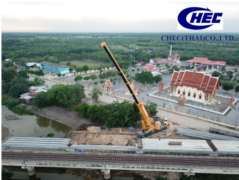
中国港湾（泰国）有限公司