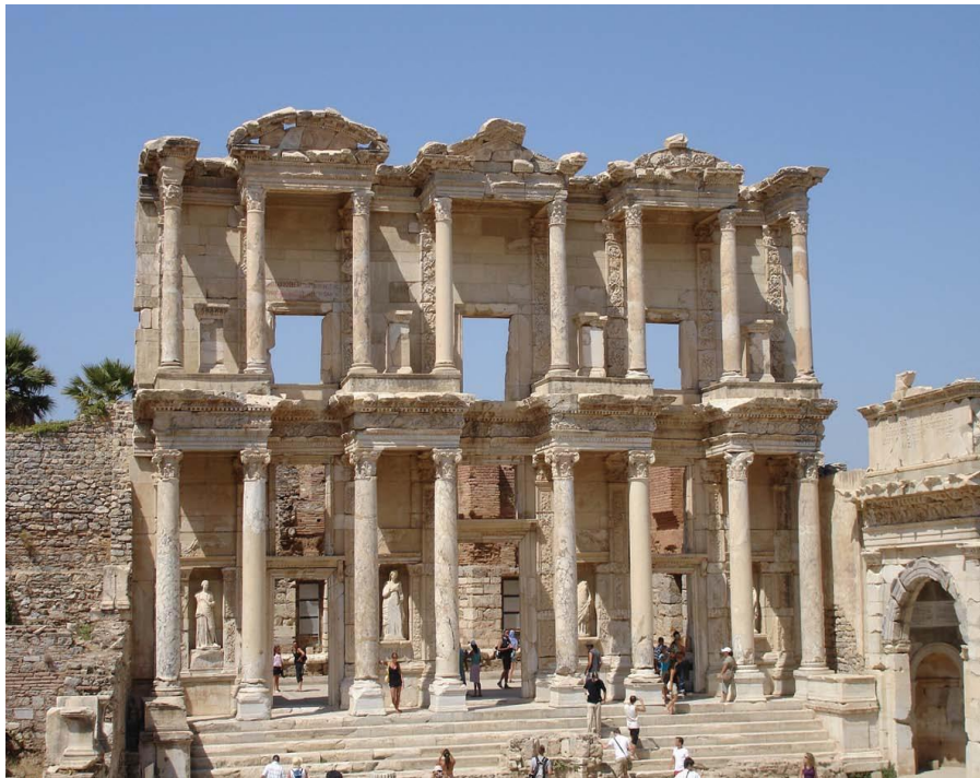
土耳其名胜古迹——埃菲斯

穆斯塔法·凯末尔·阿塔图尔克，革命家、改革家、作家，土耳其共和国缔造者、第一任总统、总理及国民议会议长。1934年11月24日，土耳其国会向凯末尔赐予“阿塔图尔克”一姓，意为“土耳其人之父”。执政期间，凯末尔施行了一系列改革，史称凯末尔改革，为土耳其成为世俗化、现代化国家奠定了重要基础。