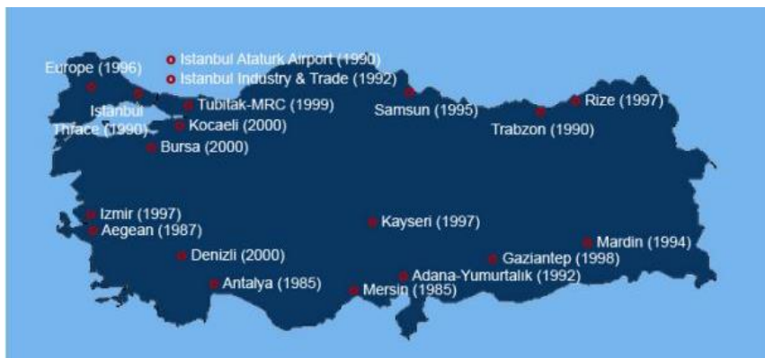
图3-2：自由经济区地理位置和设立时间

土耳其自由经济区内允许从事各种活动，包括生产、存储、包装、一般贸易和银行业务。投资者可不受任何约束地创建自己的设施，经济区还为投资者提供办公场地、生产车间或仓库，政策对投资者非常有利。各领域的活动都向土耳其和外国公司开放。