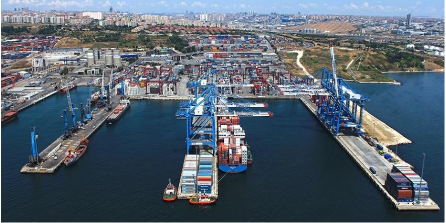
土耳其著名码头——伊斯坦布尔KUMPORT码头

土耳其北、西、南三面环海，即黑海、马尔马拉海、爱琴海和地中海，还有达达尼尔海峡和博斯普鲁斯海峡，海岸线长达7200公里，这使其海上运输颇具竞争优势。