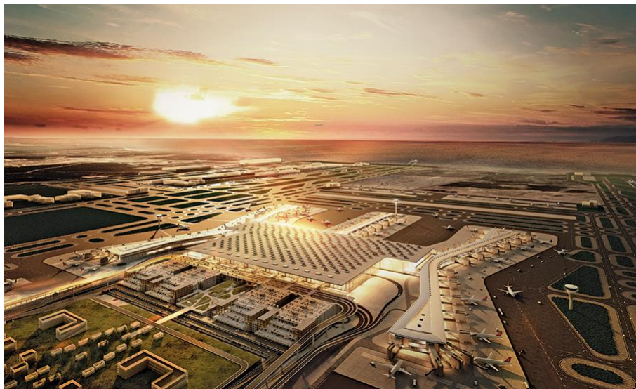
土耳其著名机场——伊斯坦布尔新国际机场

据土耳其航空管理总局统计,2018年搭乘土耳其各家航空公司的国内旅客数量同比增长6.84%,达到1.1亿人次;国际旅客数量同比增长9758万人次。国内航班的数量同比增长2.61%,为90.93万班次;国际航班数量同比增长4.3%,为59.11万班次。