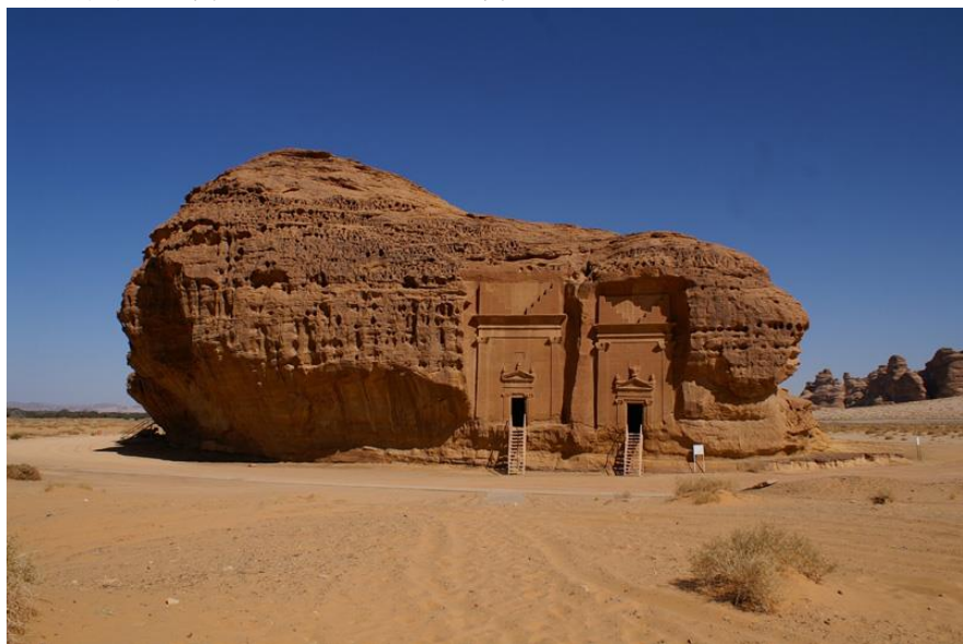
世界文化遗产——美达因萨利赫

在沙特的华人华侨以从事小商业、旅店等服务业为主，少数人在沙特政府部门、商工会、学校、企业等任职。