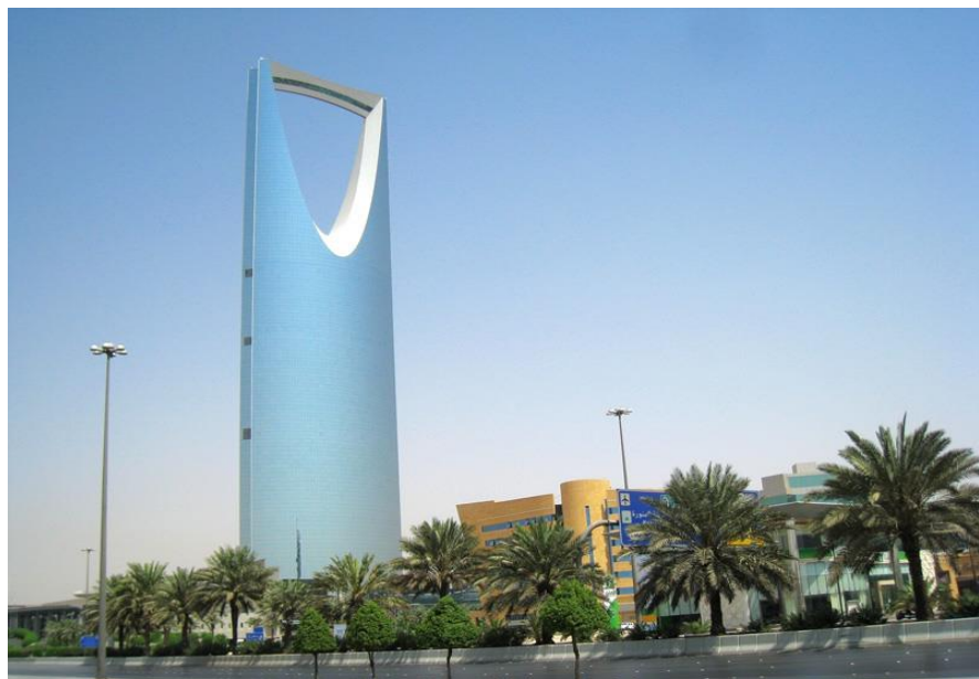
利雅得王国中心大厦

沙特石油剩余可采储量 363亿吨 ，占世界储量的 26% ，居世界首位；天然气剩余可采储量 8.2万 亿立方米，占世界储量的 4.1% ，居世界第四位。沙特还有金、铜、铁、锡、铝、锌等矿藏。沙特是世界上最大的淡化海水生产国，其海水淡化量占世界总量的 20% 左右。