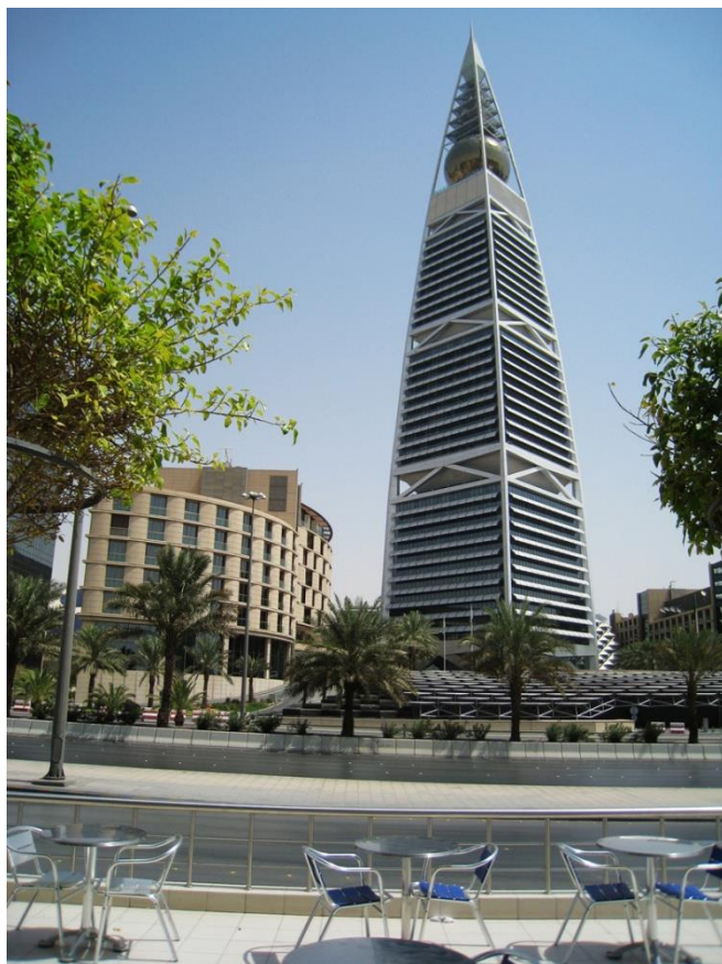
利雅得菲萨利亚塔

首都利雅得（Riyadh）是沙特第一大城市和政治、文化中心及政府机关所在地，位于沙特中部，城区面积1219平方公里，人口约822万，其中沙特籍人口约466万，非沙特籍人口约356万。