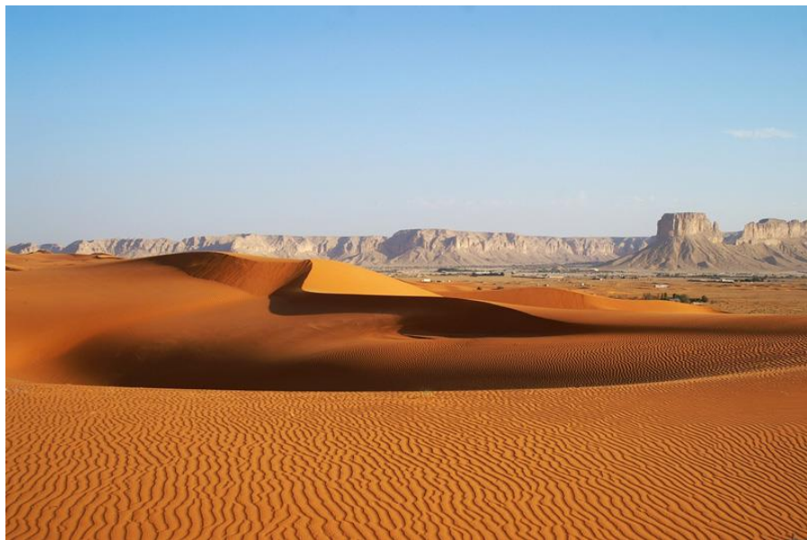
利雅得市郊红沙漠

公元7世纪，伊斯兰教创始人穆罕默德的一些继承者建立阿拉伯帝国，8世纪为鼎盛时期，版图横跨欧、亚、非三大洲。11世纪阿拉伯帝国开始衰落，16世纪为奥斯曼帝国所统治。19世纪英国侵入，当时分汉志和内志两部分。20世纪初，内志酋长阿卜杜勒阿齐兹·沙特经过30年征战，逐步统一了阿拉伯半岛，1924年，阿卜杜勒阿齐兹·沙特兼并汉志，次年自封为国王，1932年9月23日，宣告建立沙特阿拉伯王国，这一天被定为沙特国庆日。