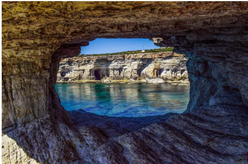
阿依纳帕（圣纳帕）海洞

在到访游客中，来自欧洲的为347.3万人次，占88.2%；亚洲38.3万人次，占9.7%。主要旅游来源国为英国（132.87万人次）、俄罗斯（78.4万人次）、以色列（23.3万人次）、德国（18.9万人次）和希腊（18.6万人次）。为进一步推动旅游业升级转型，2019年1月1日塞浦路斯旅游部（副部级）正式成立。