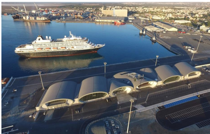
利马索尔游轮码头

塞浦路斯主要港口有利马索尔、拉纳卡两个多用途港口，瓦西里科（Vassiliko）工业港口，以及莫尼（Moni）、德克里亚（Dekeleia）两个油轮码头。大约70条国际海运航线把塞浦路斯列入其固定航线，穿梭于五大洲之间。利马索尔港是全国最大和最主要的港口，集中了全国95%以上的集装箱业务和大部分散货业务。根据国际债权人的要求，塞浦路斯政府决定对利马索尔港口私有化。经过招标程序，塞政府将游轮及综合码头运营权和集装箱码头运营权分别交由迪拜码头世界公司和德国欧洲之门公司运营。经过两年多的升级改造，集装箱码头吞吐能力达到50万标箱，新建的游轮码头在2018年接待了68艘游轮，2019年预计接待93艘游轮。