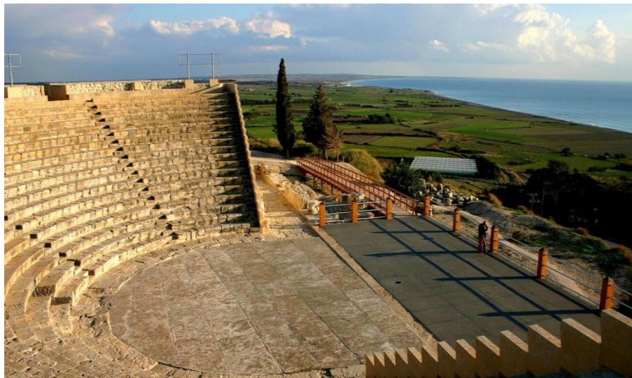
库伦剧场考古遗址

土耳其族占9.6%，外籍人占17.6%。此外，在土族控制的北部地区还有来自土耳其的移民居住，塞浦路斯政府一直未承认这部分移民的合法身份，人口调查时也未将其统计在内。塞浦路斯分裂前希土族混居，从1974年7月开始，希腊族主要居住在塞浦路斯南部，土耳其族主要居住在塞浦路斯北部。