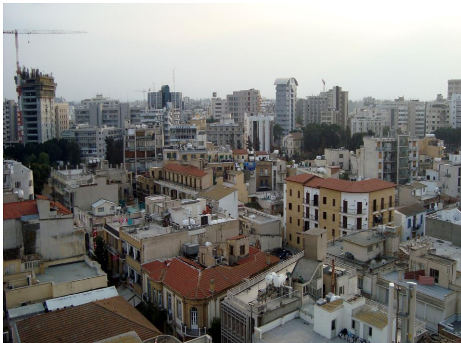
首都尼科西亚俯览

西亚市。法马古斯塔是历史古城，位于塞浦路斯岛东海岸，在塞浦路斯分裂前曾是全岛最繁华的城市。凯里尼亚市位于塞浦路斯北部海滨，是土族控制区的重要港口和旅游区。