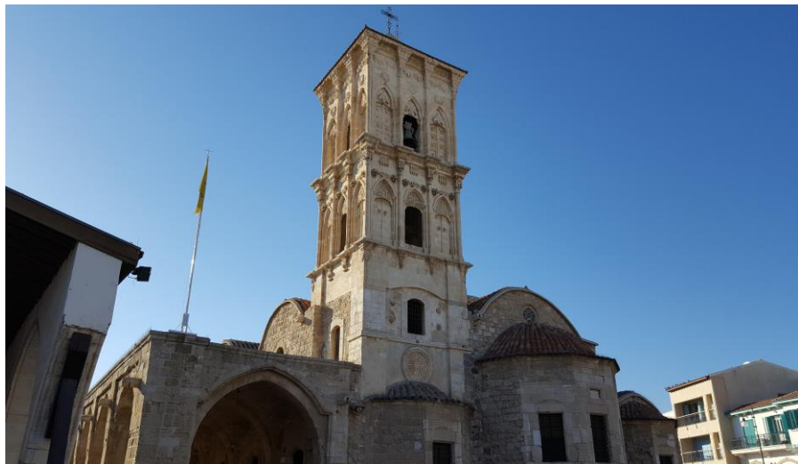
拉纳卡圣拉撒路教堂

塞浦路斯国民喜爱蓝、浅蓝、黑、白、黄等颜色；喜好假日远足、野炊、打猎等户外活动；尤喜饮咖啡，当地大多咖啡馆全天营业。