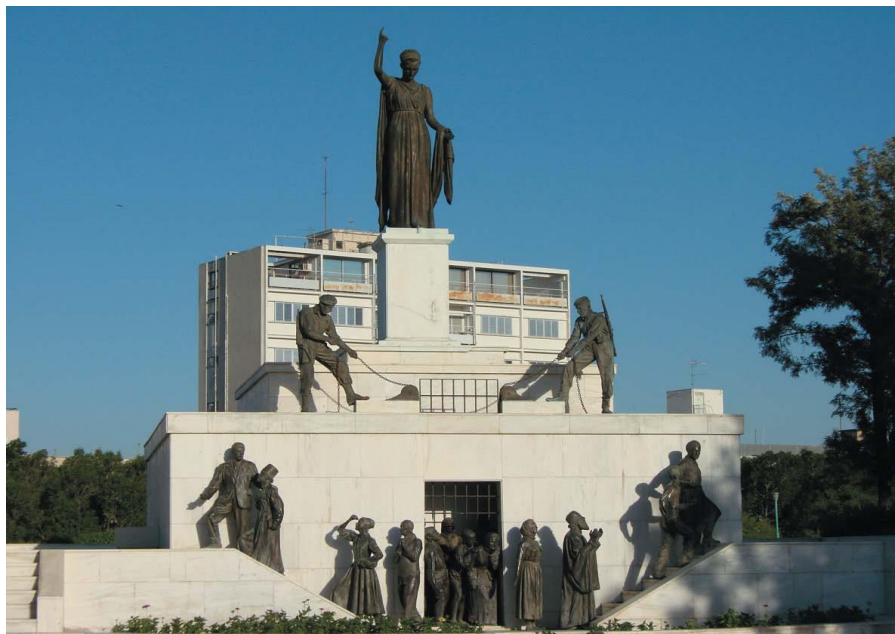
尼科西亚解放纪念碑

【同希腊的关系】塞浦路斯同希腊的关系非常特殊。塞浦路斯希族一直保持着同希腊一样的语言、文化传统和宗教信仰。希腊是塞浦路斯的母国和安全保证国，塞浦路斯一直把塞希关系放在其对外关系中的首位。1974年，为使塞浦路斯与希腊合并，塞浦路斯的希腊族人发动了政变；因土耳其人趁机入侵，结果造成了时至今日南北分裂局面。同为联合国、北约和欧盟成员国，希腊一贯支持塞浦路斯在解决塞浦路斯问题上的立场；此外，希腊还历来是塞浦路斯最重要的进出口贸易伙伴国。