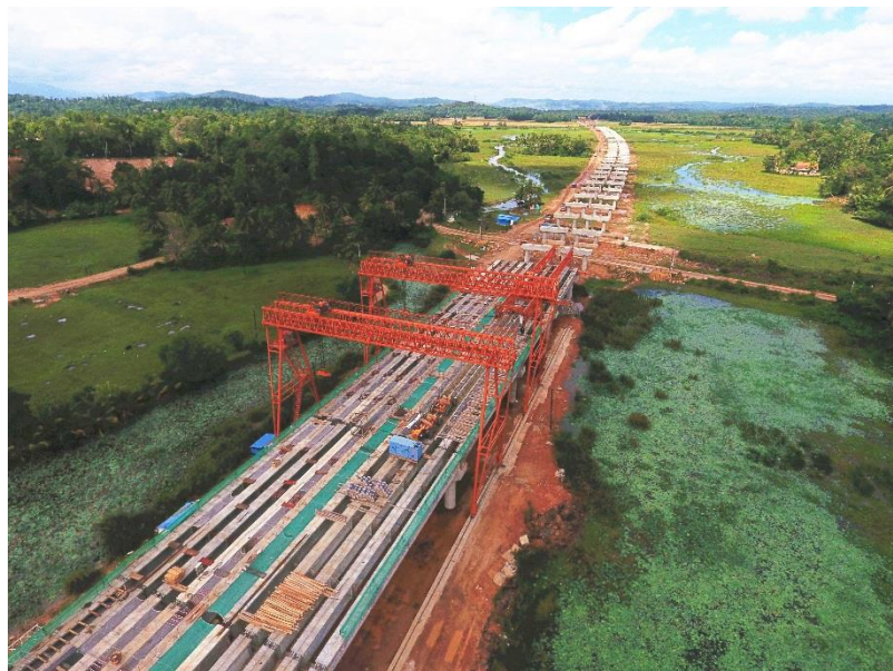
南部高速延长线项目第一标段

【在建大型工程项目】科伦坡港口城项目，是中国交建集团投资14亿美元兴建的大型填海造地及城市综合体开发项目，是斯迄今最大投资项目。目前吹填造地269公顷已全部完成，一期市政工程已开工，力争打造为南亚综合性的新兴商务、金融中心。