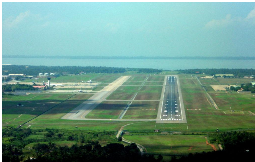
班达拉奈克国际机场

目前，中国国际航空公司执行成都至科伦坡直达航班，中国东方航空公司执行上海、昆明至科伦坡直达航班，中国南方航空公司执行广州至科伦坡航班，旅客可以搭乘中国民航班机，通过成都、上海、昆明、广州等口岸转机到达科伦坡；同时，斯里兰卡航空公司执行北京、上海、广州和昆明至科伦坡直达航班；旅客也可通过香港、曼谷、新加坡、马来西亚吉隆坡等地转机来科伦坡。