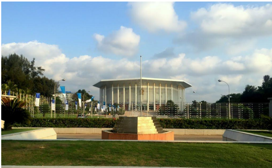
中国政府援建的纪念班达拉奈克国际会议大厦