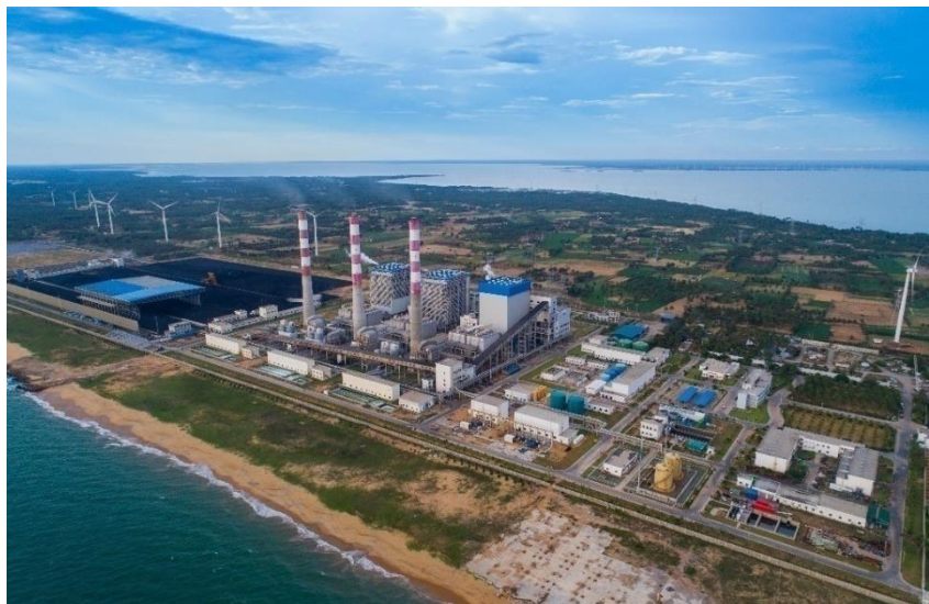
普特拉姆燃煤电站