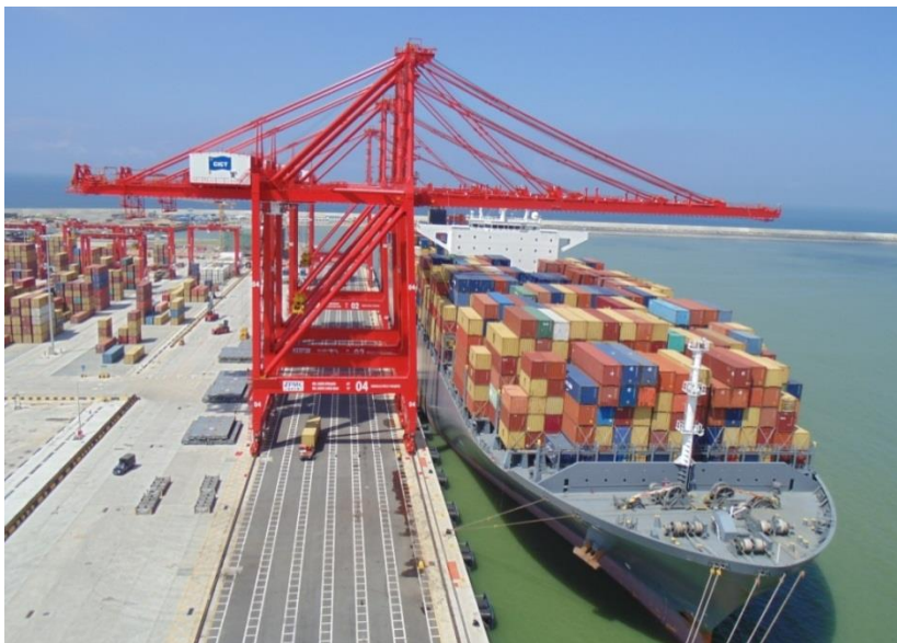
科伦坡港南集装箱码头

斯里兰卡正在进行科伦坡港扩建工程，包括东、西两个深水集装箱码头。建成后，科伦坡港将增加720万标箱的吞吐量。2014年4月，招商局集团投资的科伦坡港南集装箱码头项目顺利竣工。2018年科伦坡南集装箱码头共停靠船舶1,293艘，吞吐量超过268万标箱，占科伦坡港的38%。