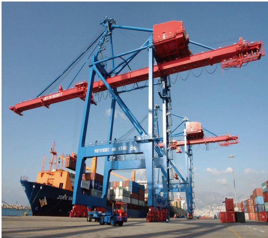
贝鲁特港口新标志——上海振华港机

的黎波里港新泊位于2016年1月正式启用，新码头岸线长600米，港池水深15.5米。新泊位的运行将为2000多人提供新的就业机会。2013年，的黎波里港口同阿联酋酋GULFTAINER公司签约，由该公司以BOT方式进行黎波里港口新建集装箱码头的后续建设和运营，特许经营权为25年。