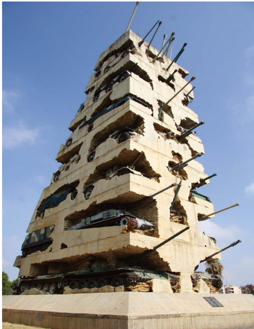
黎巴嫩内战纪念碑