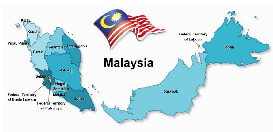
马来西亚行政区划

马来西亚分为13个州和3个联邦直辖区。13个州包括西马的柔佛、吉打、吉兰丹、马六甲、森美兰、彭亨、檳城、霹靂、玻璃市、雪兰莪、登嘉楼和东马的沙捞越、沙巴。3个联邦直辖区为首都吉隆坡(Kuala Lumpur)、联邦政府行政中心——布特拉加亚(Putrajaya)和东马的纳闽(Labuan)。马来西亚其他主要的经济中心城市包括：乔治市(檳城州首府)、新山(柔佛州首府)、关丹(彭亨州首府)和古晋(沙捞越州首府)。由于历史原因，东马的沙捞越和沙巴两州在政治和经济上拥有较大自主权。