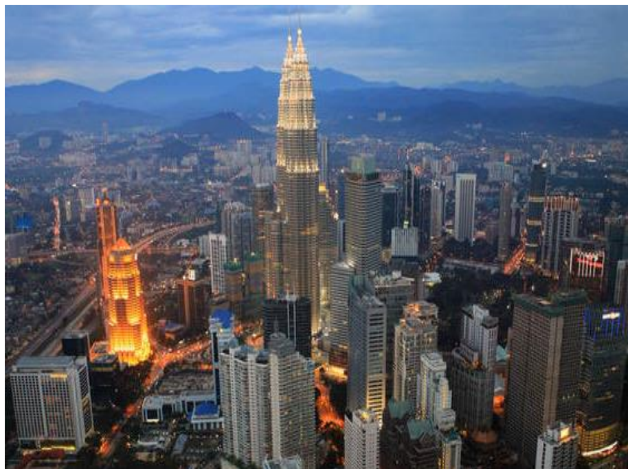
从吉隆坡塔俯瞰全城

建造、管理统一由国家大道局负责。马来西亚公路总长约为21.7万公里。相较于西马，沙巴与砂拉越的公路系统发达程度较低，品质也较差。目前，马来西亚高速公路网络由贯穿南北的大道为中心构成。