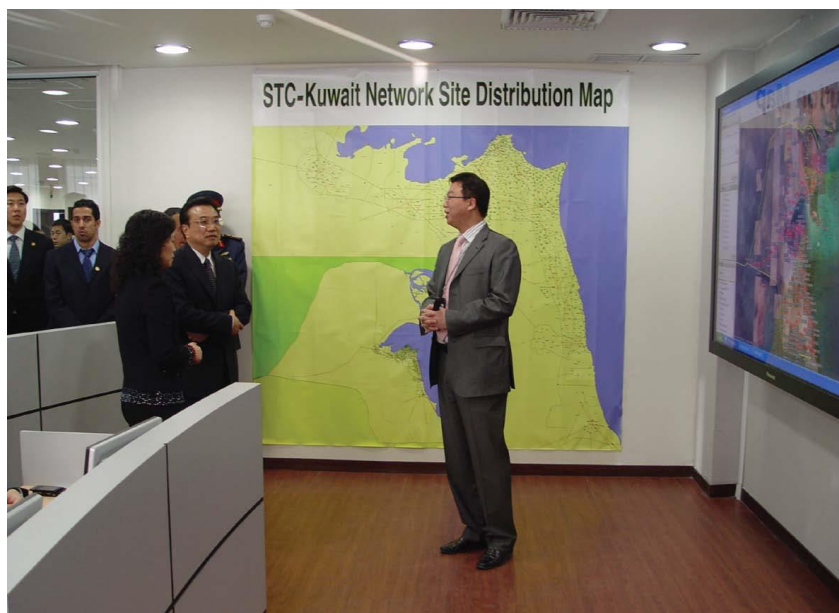
李克强总理视察华为分包承建的第三套移动通讯网