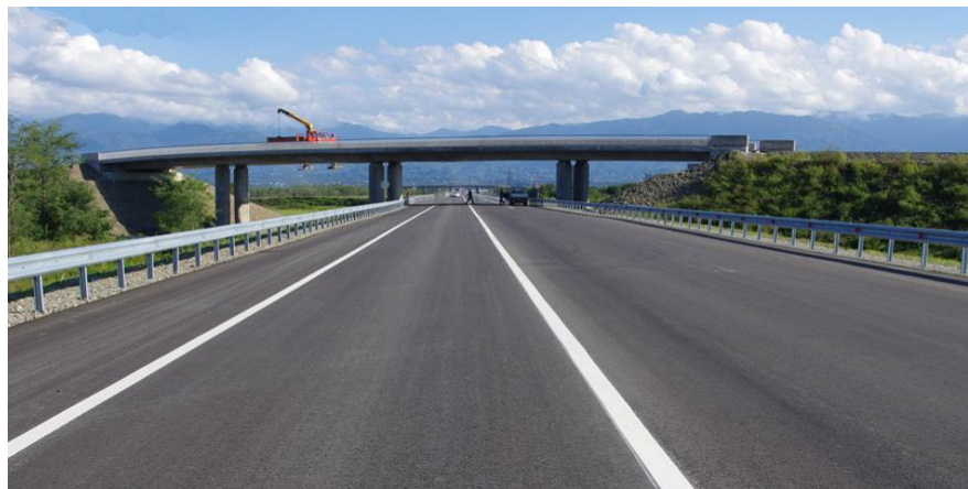
中水电十六局承建的KOBULETI绕城公路项目