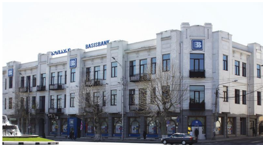
新疆华凌集团收购的基础银行

2019年3月底，格鲁吉亚中央银行公布的美元兑拉里中间价是2.6914，欧元兑拉里中间价是3.0203。