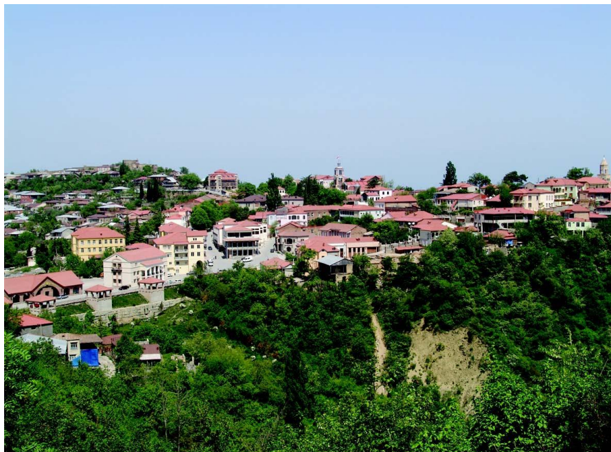
格鲁吉亚小镇——锡格纳基