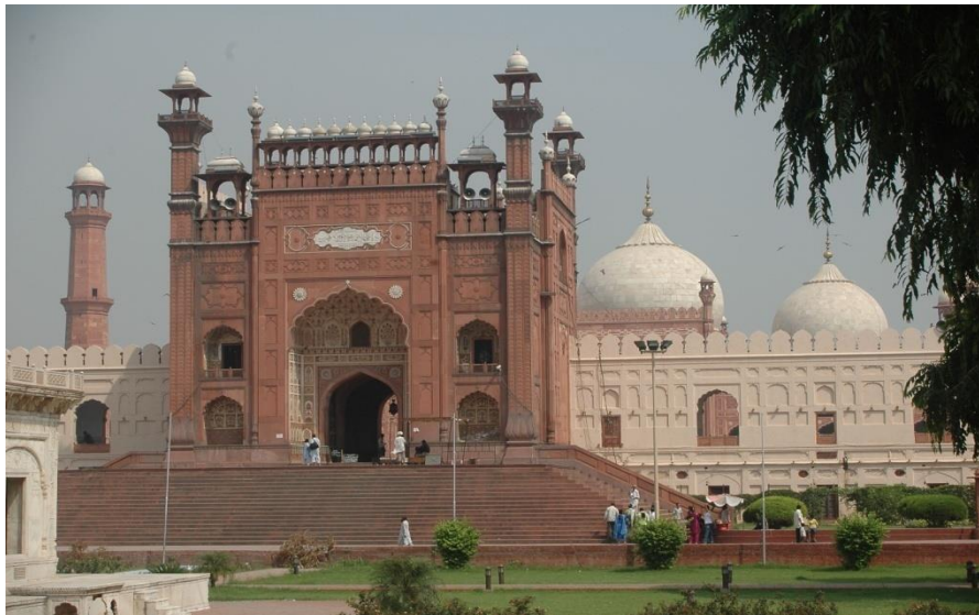
拉合尔市巴德夏希清真寺