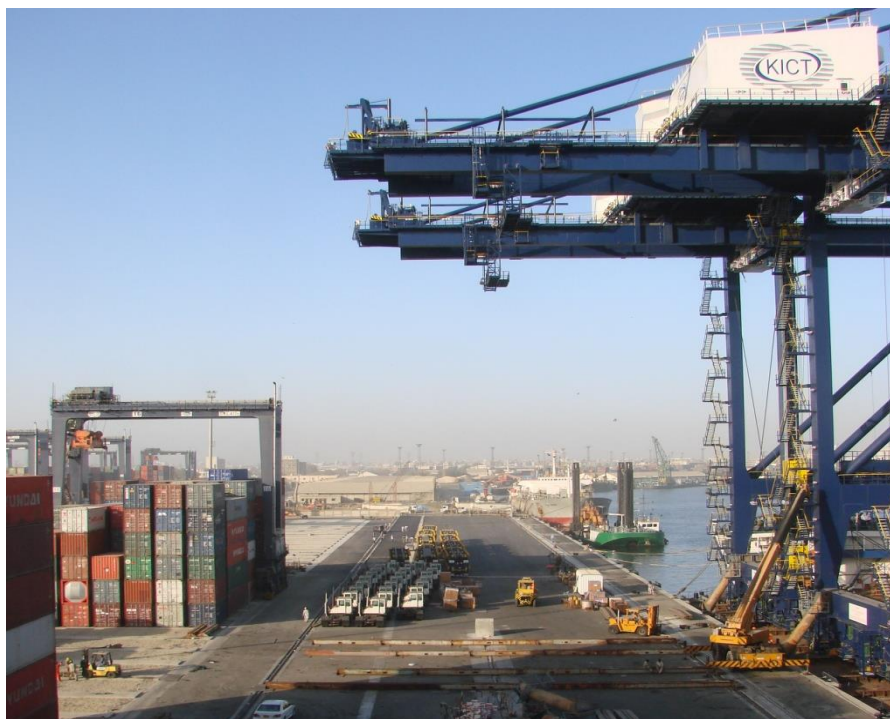
巴基斯坦最大的海港——卡拉奇港