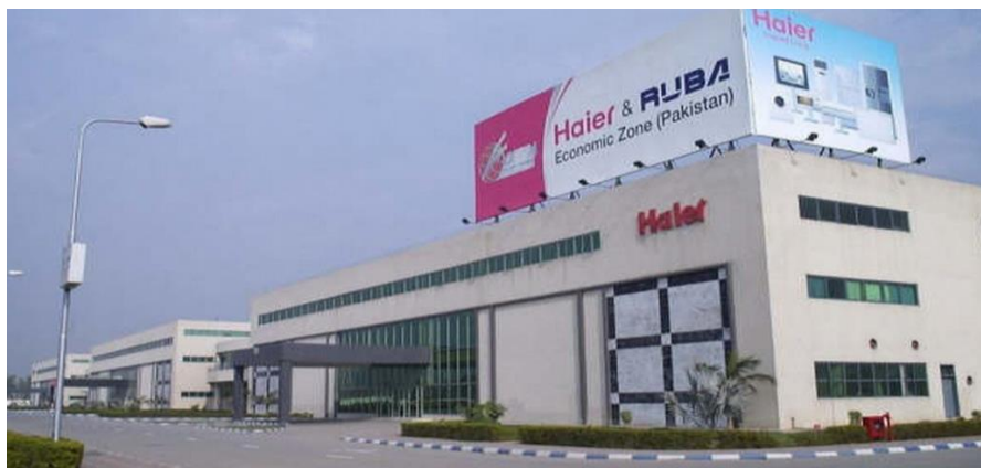
海尔鲁巴经济区厂区

【经贸合作区】2006年11月26日，由胡锦涛主席亲自揭牌成立的海尔—鲁巴经济区为中国企业在巴基斯坦投资兴业提供了新的平台。该区位于巴基斯坦第二大城市拉合尔，是中国商务部批准设立的首个“中国境外经济贸易合作区”，也是巴基斯坦政府批准建设的“巴基斯坦中国经济特区”，是中巴合作五年规划的重点项目之一。该区重点发展的产业为小家电及发电设备、汽车摩托车及配件、化工及包装印刷业等（详情可参阅hrsez.haier.com，电话：0532-88938290/8213，传真：0532-88938029）。