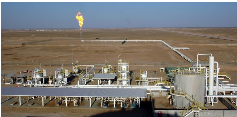
中石油阿曼5区块作业现场

【双向投资】据中国商务部统计，2018年当年中国对阿曼直接投资流量5191万美元。截至2018年末，中国对阿曼直接投资存量1.51亿美元。2018年重点投资项目主要有：中阿（杜库姆）产业园一期，预计于2021年建设完成；江苏常宝钢管股份有限公司油井管加工线于10月竣工投产，投资金额2000万美元；沈阳华氏食品饮料有限公司投资设立阿曼塑料有限公司，建设饮料包装厂，预计投资金额1亿美元；河南正佳能源环保股份有限公司计划投资2000万美元建设聚合物工厂，已进入建设阶段。2018年当年，阿曼无对华直接投资，截至2018年末，阿曼在华投资1922万美元，项目数量4个。阿曼石油公司与韩国GS集团签订协议，购买了青岛丽东化工有限公司30%的股份。