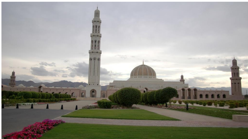
苏丹卡布斯大清真寺

伊斯兰教为国教，阿曼穆斯林多属伊巴德教派（IBADISM），公元7世纪，著名宗教学者贾比尔·本·宰依德在伊拉克的巴士拉学习深造时领悟创立此教派，其弟子伊巴德继承并发展了他的学说，并由此得名。在伊斯兰教中，伊巴德教派是一个独特的教派，教义以《古兰经》和《圣训》为基础，主张哈里发的继承人不应限于穆罕默德家族，应由贤者任之，不支持阿里，与什叶派相对立，接近逊尼派。伊巴德教派在阿曼占统治地位，在北非的阿尔及利亚、突尼斯、利比亚等国也有少量信徒。