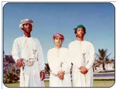
阿曼人的正式着装

【服饰】阿曼男子虽与大多数阿拉伯人一样穿无领长袖大袍、戴头巾，但有明显的不同：一是袍子的领口右侧垂有花穗，可以蘸注香水；二是头巾质地讲究，有很漂亮的花纹，扎缠在头，与沙特等国不同。在正式场合，男子一般习惯穿无领长袍，扎缠头巾，佩带弯刀（Khanjar），脚穿露出脚指的皮凉鞋。妇女喜饰金，服装艳丽。阿曼人能歌善舞，不过一般都是女歌男舞，男人在圈中欢快地跳舞，妇女则在外面以拍手唱歌伴舞。